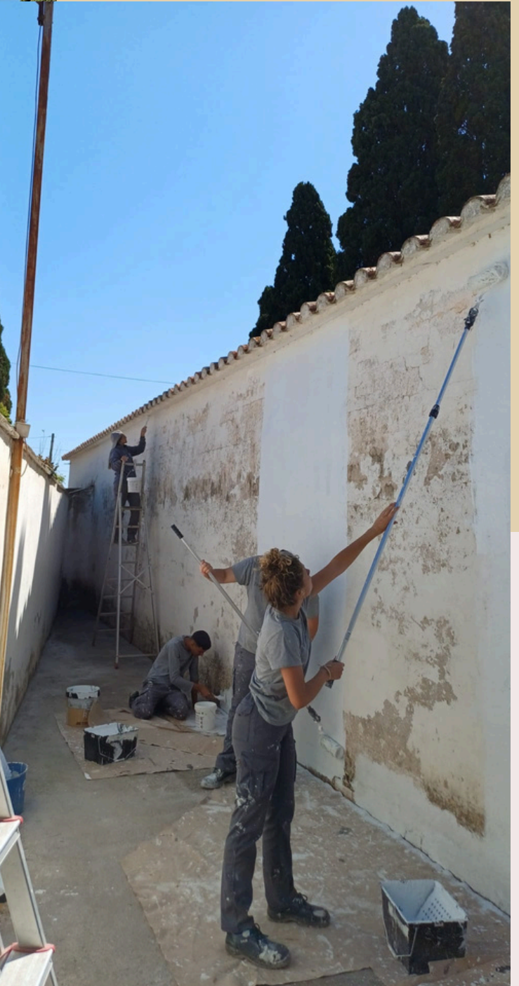
PINTURA ZONA DE BANYS PÚBLICS