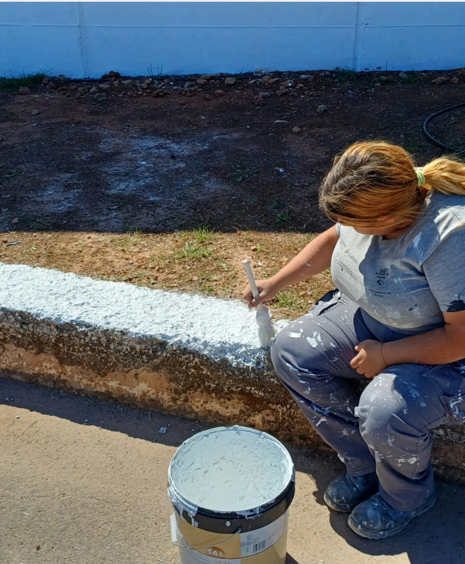
PINTURA DEL MURET PERIMETRAL