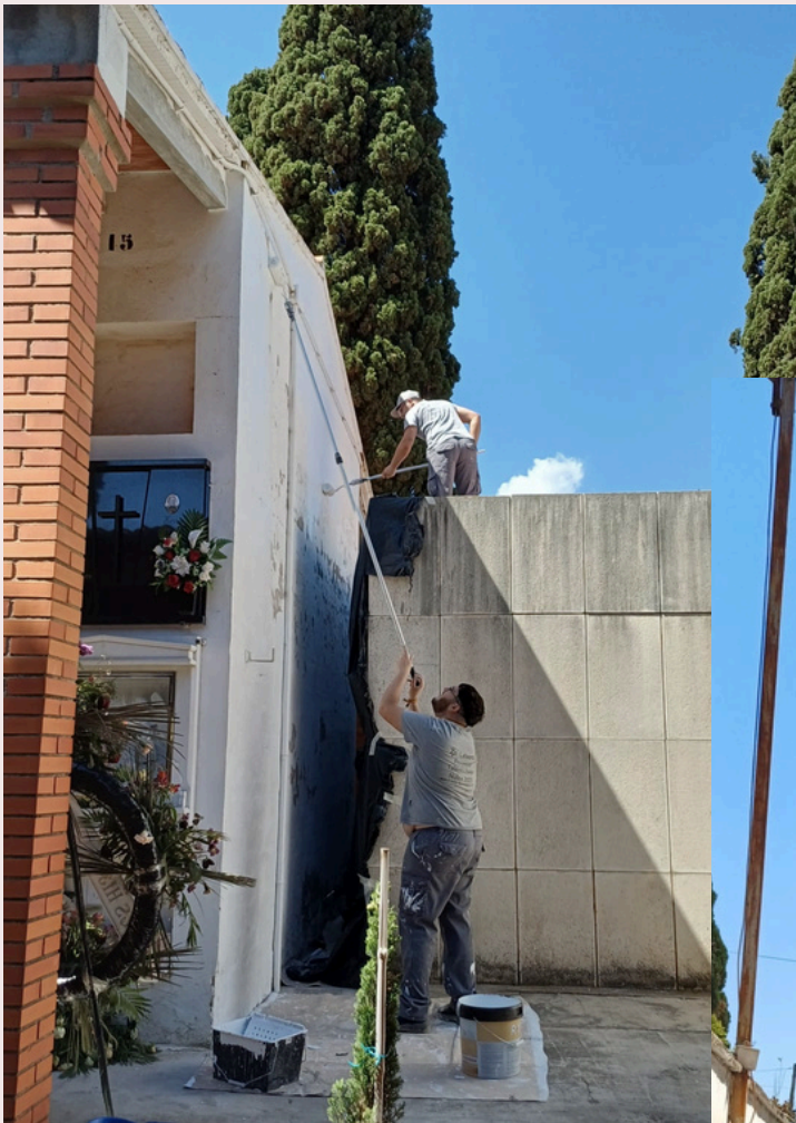
PINTURA ZONA DE MAGATZEM