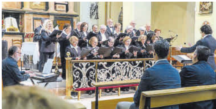
La Coral Sant Bartomeu va oferir un concert a l'església arxiprestal.