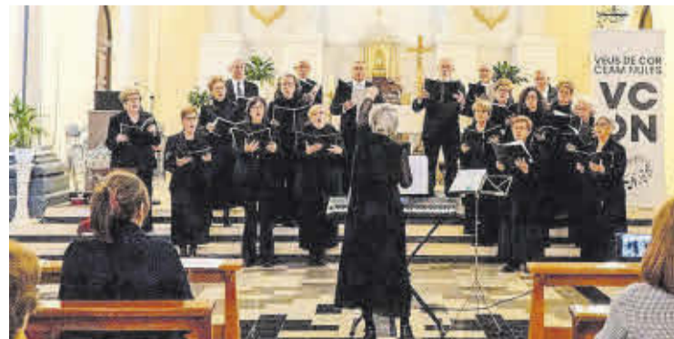
La Coral Veus de Cor del CEAM va actuar a l'església de la Immaculada.