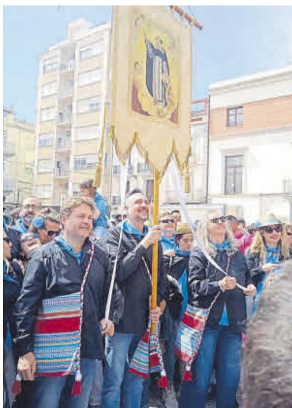
Els clavaris del 99 arriben a l'ajuntament amb el guió.