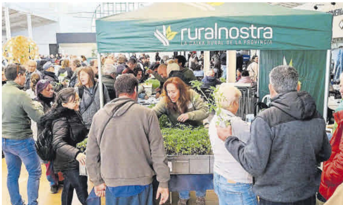
L'intercanvi de llavors i planter tradicional va ser una de les propostes centrals de la jornada mundial.