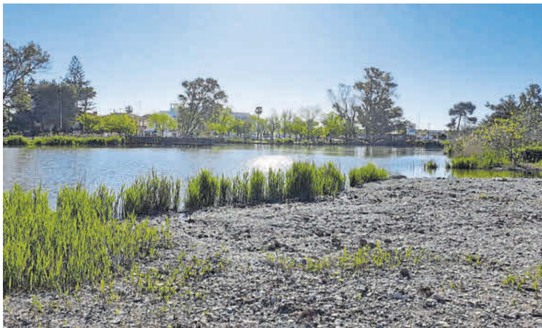
imatge de la llacuna que s'ha creat en el parc natural de l'Estany de Nules per a recuperar l'hàbitat de la xitxarra d'aigua.

Aquesta actuació forma part d'un projecte europeu de recuperació d'espais naturals