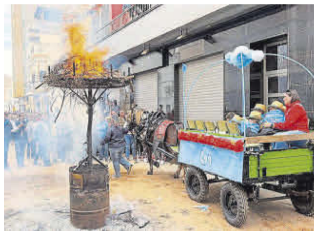
Els conductors dels carros mostren la seua habilitat en la foguera.

Els organitzadors impulsen una edició marcada per la participació massiva, una exposició sense precedents i la primera dona clavari