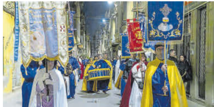
Desfilada durant l'inici de l'Exaltació del Bombo i Tambor.