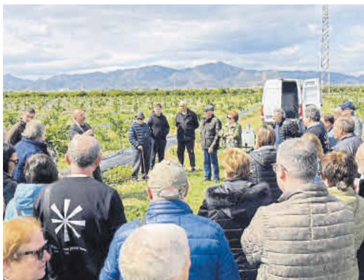
La jornada 'Arrels' incluyó un taller de demostración de uso de drones.