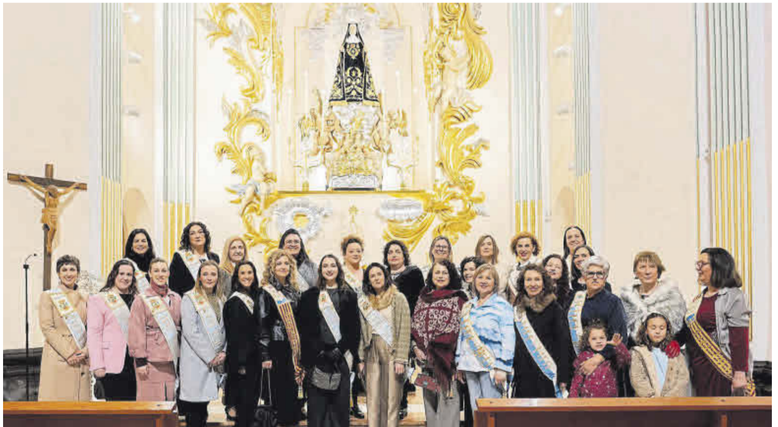
Todas las mujeres que han sido damas de la Caixa Rural se reunieron con motivo del centenario y también visitaron la capilla de la Virgen de la Soledad.

Los actos conmemorativos continuaron el 27 de marzo con el estreno en el salón social del vídeo del centenario que recoge un siglo de historia en imágenes, realizado por Grábalo en la memoria. A continuación la capilla de la Virgen de la Soledad fue el escenario del homenaje conjunto de Caixa Rural y la Cooperativa Agrícola a la patrona del municipio. Un momento de recogimiento y emoción, para poner en valor todo aquello que une a los vecinos como pueblo y comunidad.