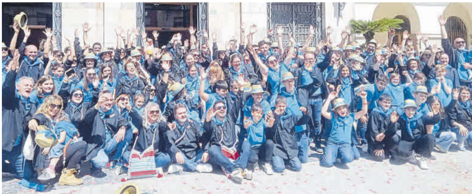
Els membres de la Quinta del 1999 es van fer una foto de família per al record en acabar la cercavila a la plaça Major de Nules.