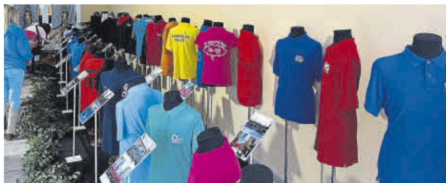
El Saló Multifuncional va acollir una exposició d'indumentària festiva de les quintes de Sant Vicent.