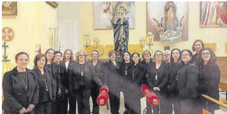
Les portadores del pas de la Mare de Déu dels Dolors.