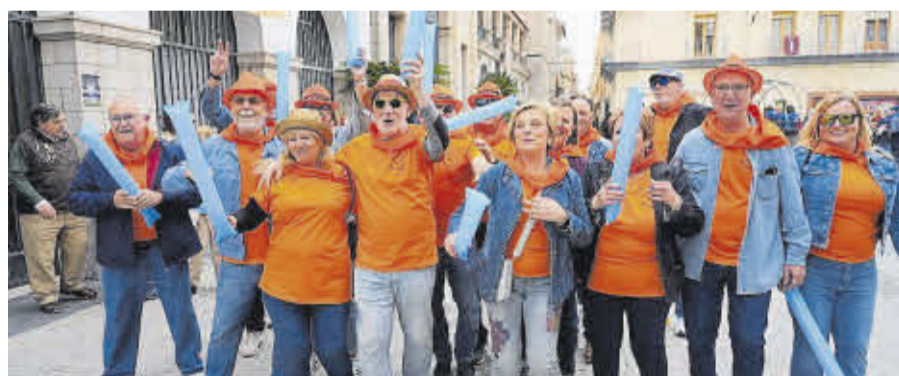
La Quinta del 1974, una de les més veteranes d'enguany, demostra que no hi ha edat per a la diversió.