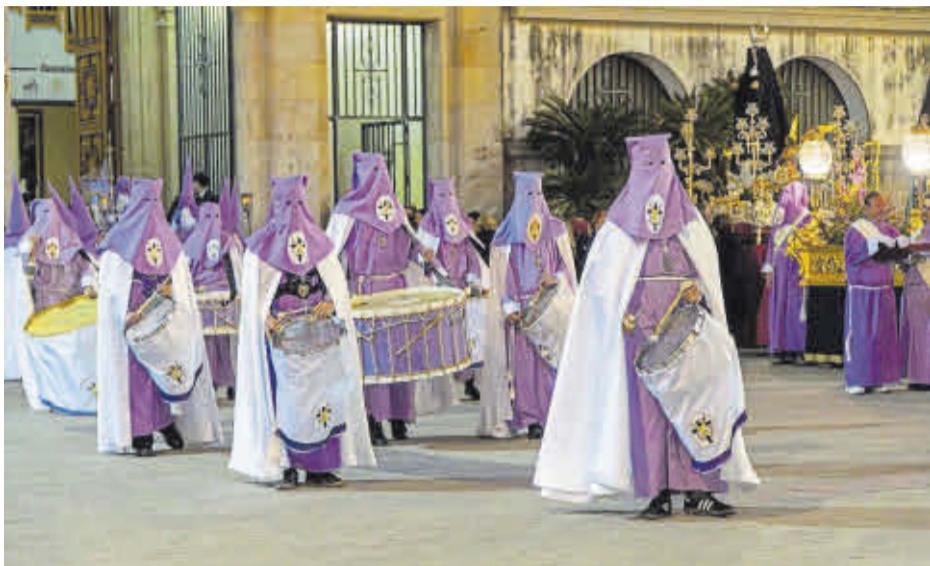
La tradicional processó del Sant Soterrament va oferir els moments més solemnes.