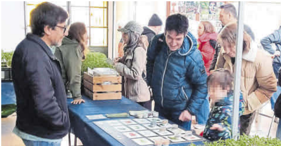
Públic de totes les edats va poder participar en les diverses activitats que es van organitzar.