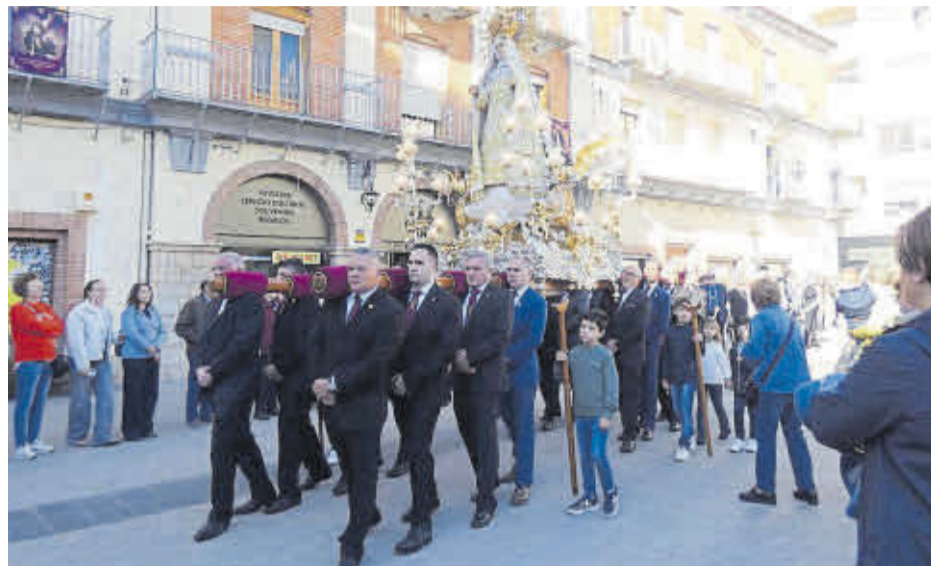
La processó del 'Encuentro' va tancar un any més les celebracions de la Setmana Santa a Nules.