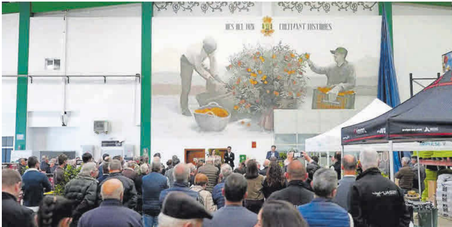
La inauguración del mural conmemorativo del centenario de la fundación de la Cooperativa Agrícola fue uno de los momentos culminantes de la programación.

Las actividades continuaron el martes 17 con la jornada sobre innovación en el sector cítrico, en la que participaron diversas empresas y especialistas, y que llevó por título Elección varietal en cítricos: la clave para mejorar la rentabilidad . Asimismo, el miércoles 18 la jornada versó sobre el regadío y en ella se rindió un homenaje a las sociedades y sindicato de riego.