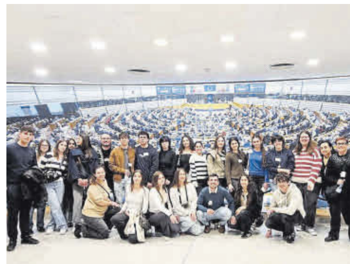
Los alumnos y profesores que participaron en la experiencia europea.