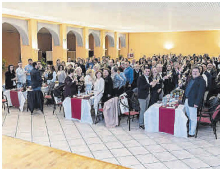
La gran cata de vino centenario supuso la apertura de la IX Fira Agrícola.