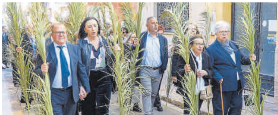
Un gran nombre de veïns van participar en els actes del Diumenge de Rams.