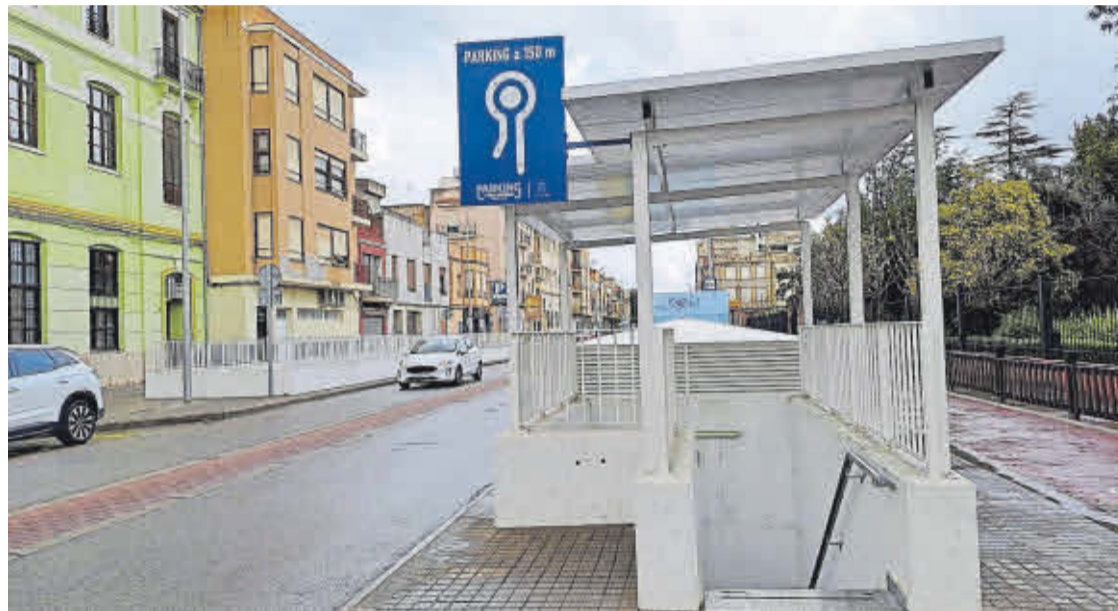
Imatge d'arxiu del pàrquing municipal de Nules, un servei que ja ha deixat de ser deficitari per a l'Ajuntament.

Gràcies al pla de gestió i millora impulsat l'any 2024 aquest servei ha deixat de ser deficitari