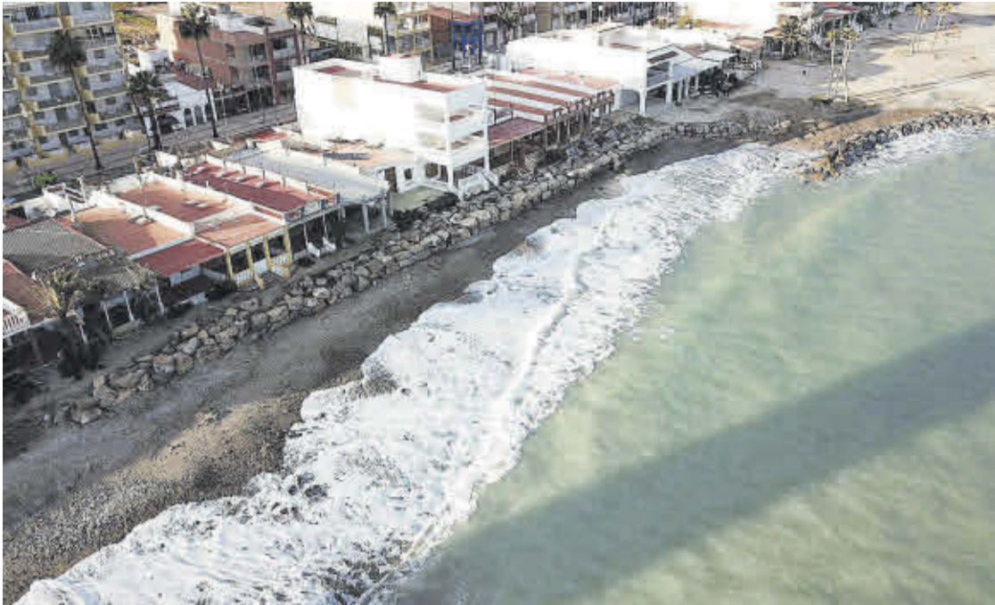
'Les Casetes' de primera línia de la mar de Nules estan més prop d'assegurar la seua protecció de cara al futur.