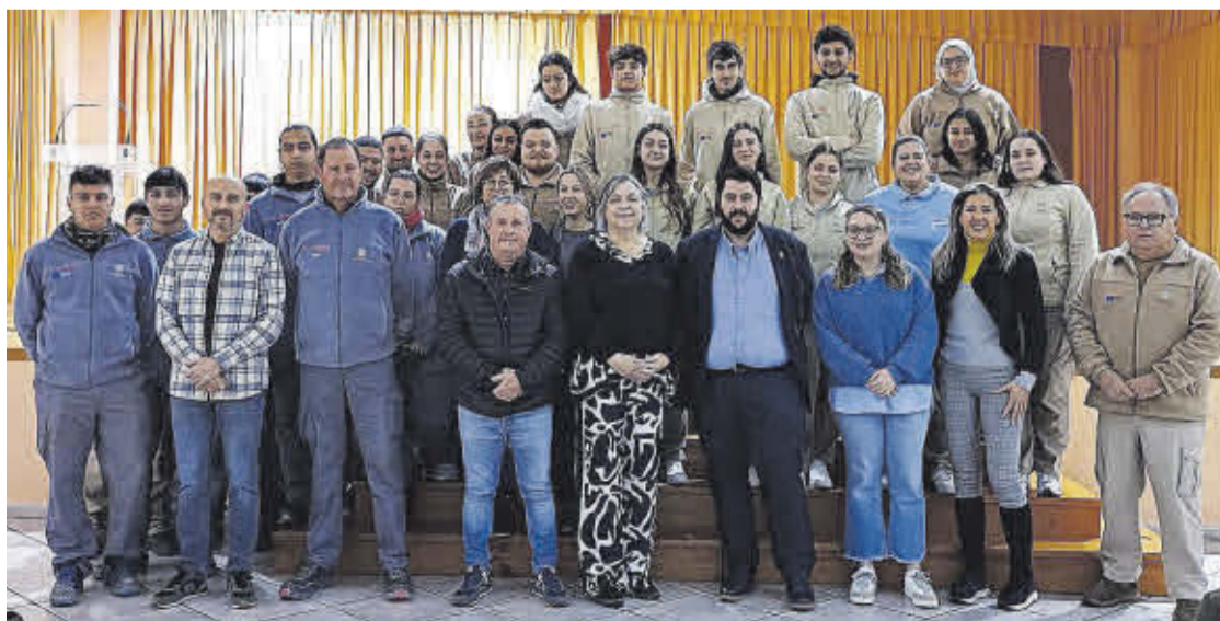
T'Avalem Nules imparteix a 30 alumnes les especialitats d'agricultura ecològica, obra i comerç.

liars de revestiments continus en construcció; paviments i obra d'urbanització; treballs de fusteria i moble; muntatge de mobles i elements de fusteria; activitats auxiliars en vivers, jardins i centres de jardineria; i instal·lació i manteniment de jardins i zones verdes.