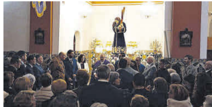
El dia abans de la processó es va beneir la nova anda del Natzaré.