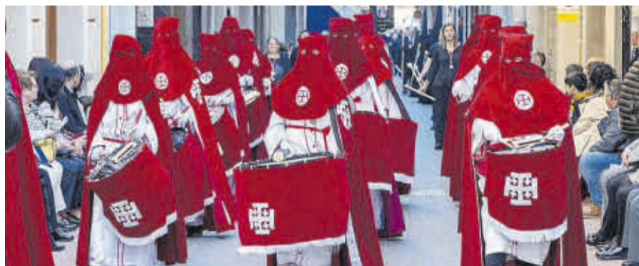
Nules i visitants van poder veure desfilat confraries de diverses localitats de la diòcesi.