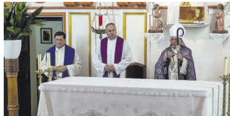
El bisbe va intervenir al Convent en acabar la processó diocesana.