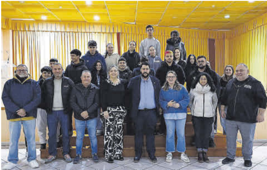
Els 20 alumnes de l'Escola Taller aprenen l'ofici d'electricista i fontaner.