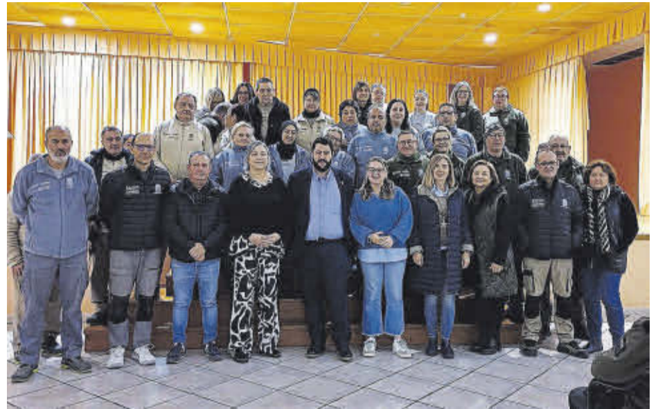
Trenta persones es formen en obra, fusteria i jardineria en el Taller d'Ocupació de Nules.