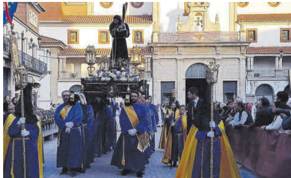
La Germandat de Natzarens va desfilat per primera vegada amb la nova anda del Natzaré.