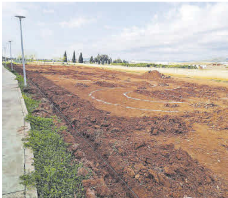
Terrenos en los que se ubicará el Laberinto Ecológico.

tribuye a una formación más completa y alineada con las necesidades actuales del sector de la agricultura ecológica, promoviendo prácticas responsables con el medio ambiente y el uso eficiente de los recursos naturales. A tal efecto se está procediendo con la siguiente planificación de los trabajos: