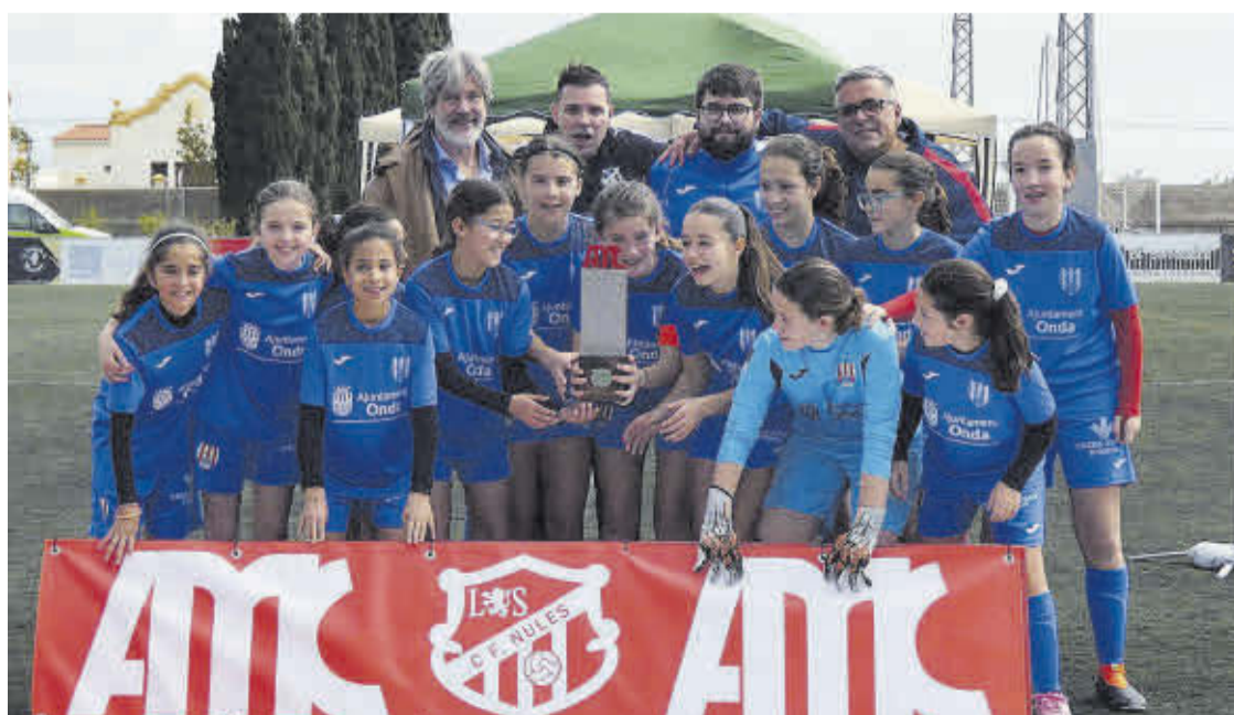
Les futbolistes del CD Onda es van proclamar campiones en la primera edició d'aquesta competició.