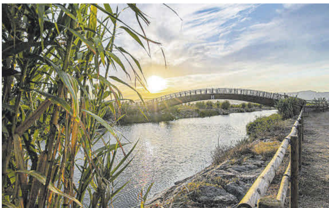
Moncofa es una localidad en la que el visitante puede disfrutar de una gran oferta turística durante todo el año.

Cuatro banderas azules, el sendero azul, un amplio programa deportivo, cultural y lúdico convierten a la localidad castellanense en un destino ideal para el descanso y la diversión