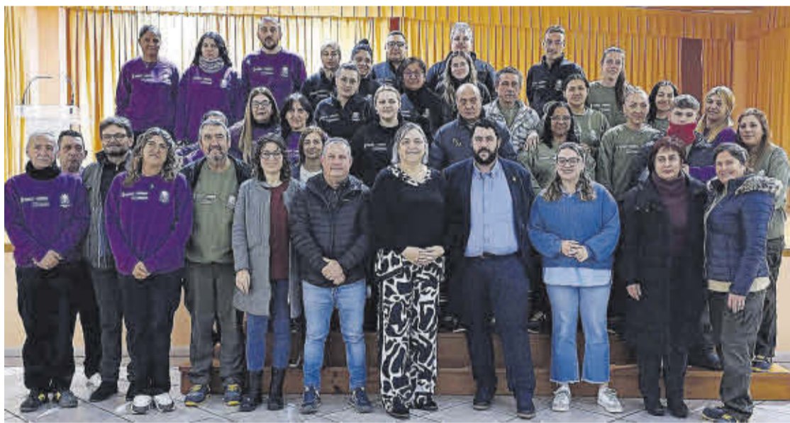
Inserta forma a 30 persones en activitats auxiliars d'agricultura, de cementeris i operacions bàsiques de cuina.

També està en marxa el Taller d'Ocupació Nules X, que amb una inversió de 824.292 euros, i amb un alumnat de 30 persones imparteix els mòduls d'obra, fusteria i jardineria, amb els quals es formarà a alumnat en operacions auxi-