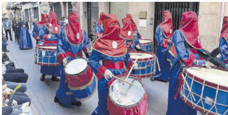
No van faltar tambors i bombos per a donar el toc solemne a la desfilada.