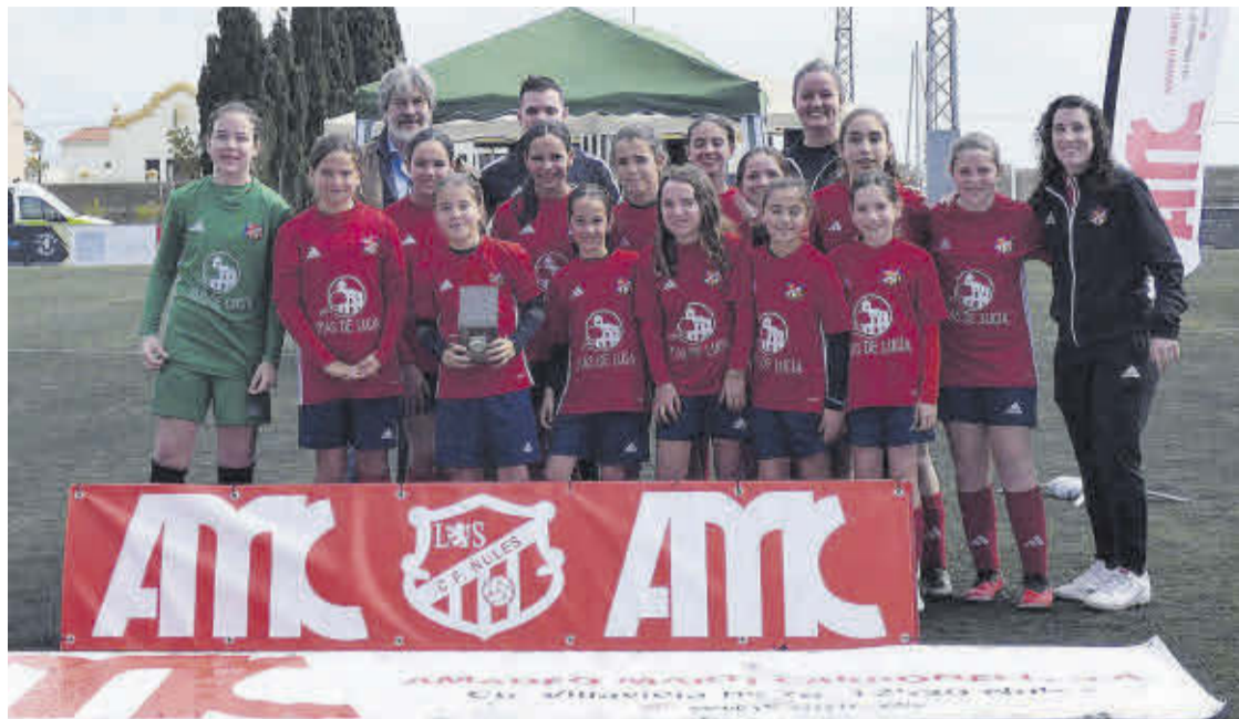
Les jugadores de l'aleví femení del CF Nules mostren el trofeu com a terceres classificades del torneig.