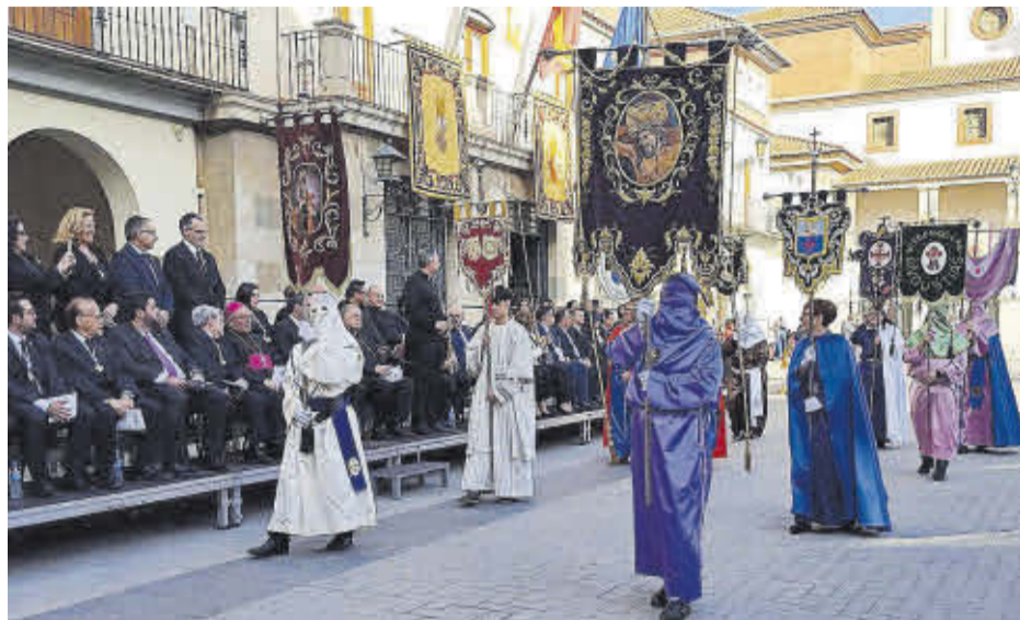
Els membres de les diverses confraries desfilen per davant de la tribuna d'autoritats.