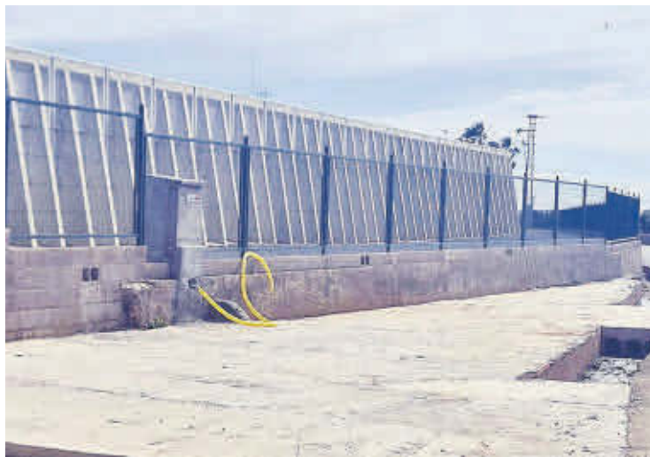
Imagen de la toma de agua en la balsa del Camí Cabeçol.

Por su lado, la Comunidad de regantes se ha encargado de realizar los trabajos de fontanería, control y conexión del agua con la balsa para que pueda ser usada de forma habitual por los