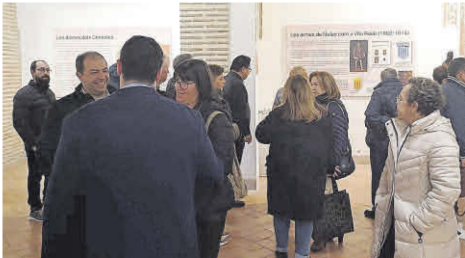
La inauguració de l'exposició va comptar amb una ampla representació de la societat local.

Una exposició al Museu d'Història Vicent Felip Sempere recull fins al 28 de març els orígens i l'evolució de l'actual escut