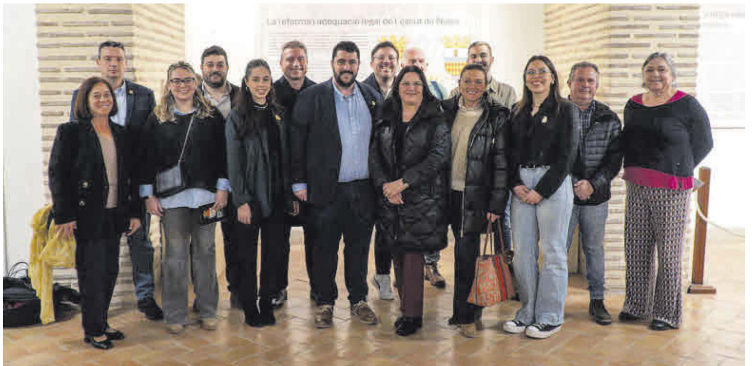
Una representació de la corporació municipal amb l'alcaldesa de la Vilavella i els cronistes de Nules i la Vilavella, a més de la reina de la vila.

L'exposició compta amb un espai de projecció on s'emet un documental en el qual el Cronista de la Vila explica aquesta evolució. La mostra es pot visitar fins el 28 de març els dilluns, dimecres i divendres de 9.00 a 14.00 hores, i dimarts i dijous de 18.00 a 20.00 hores.