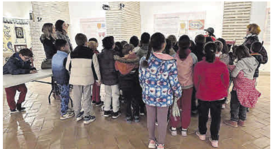
La mostra rep visites guiades per a l'alumnat de centres educatius com el CEIP Cervantes.