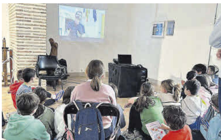
Alumnes del CEIP Pedro Alcázar miren el documental sobre l'escut.