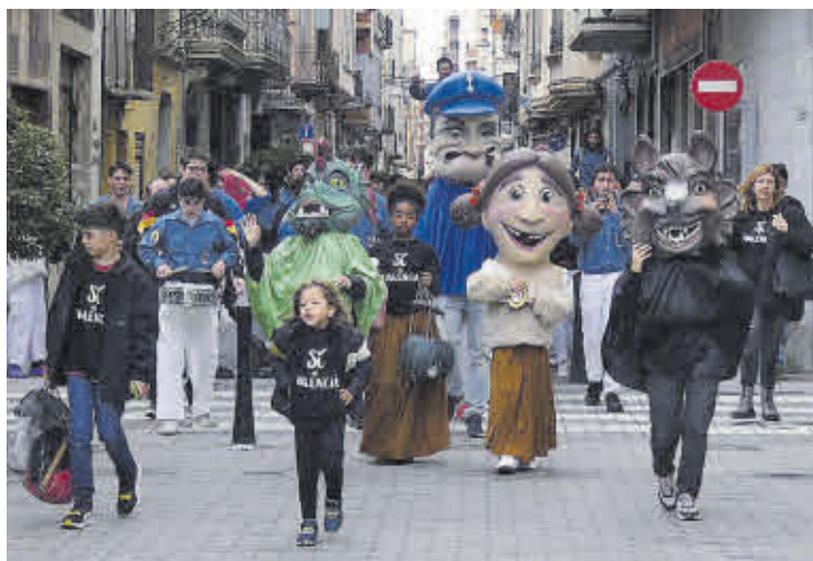
Un passacarrers amb els cabuts de Nules va obrir la programació.

Universitat Autònoma de Barcelona (UAB); i per la nit es va celebrar un concert protagonitzat per Malparits, grup tribut a la música en valencià. Aquesta actuació estava prevista inicialment al carrer del Mercat, però amb l'amenaça de la pluja es va traslladar al Local Multifuncional.