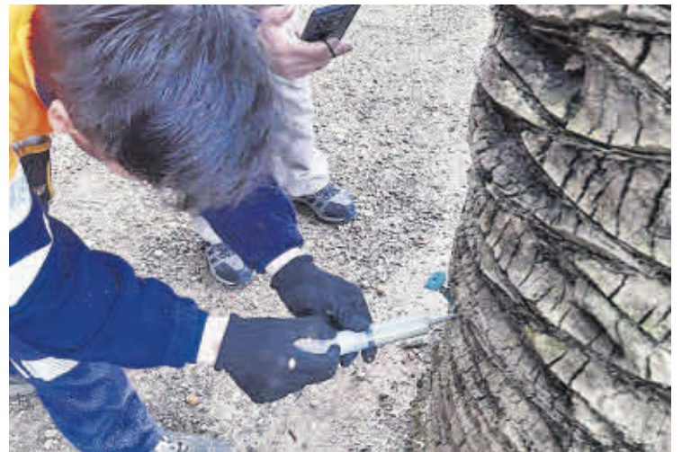
Un treballador de l'Ajuntament realitza un dels tractaments a un arbre.

*Enginyer de Forests Departament d'Agrària de l'IES Gilabert de Centelles Nules