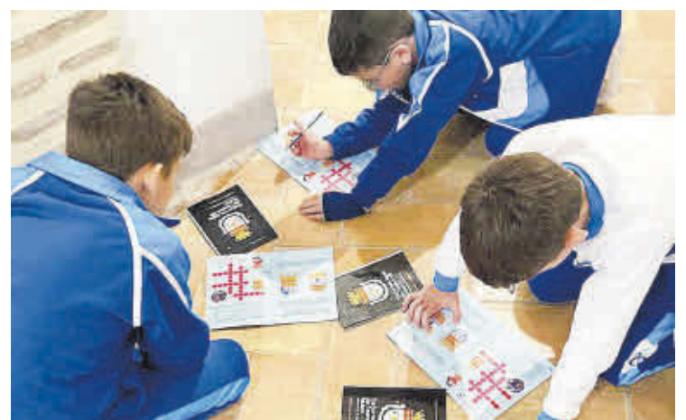
Estudiants del col·legi Consolación participen en tallers didàctics.