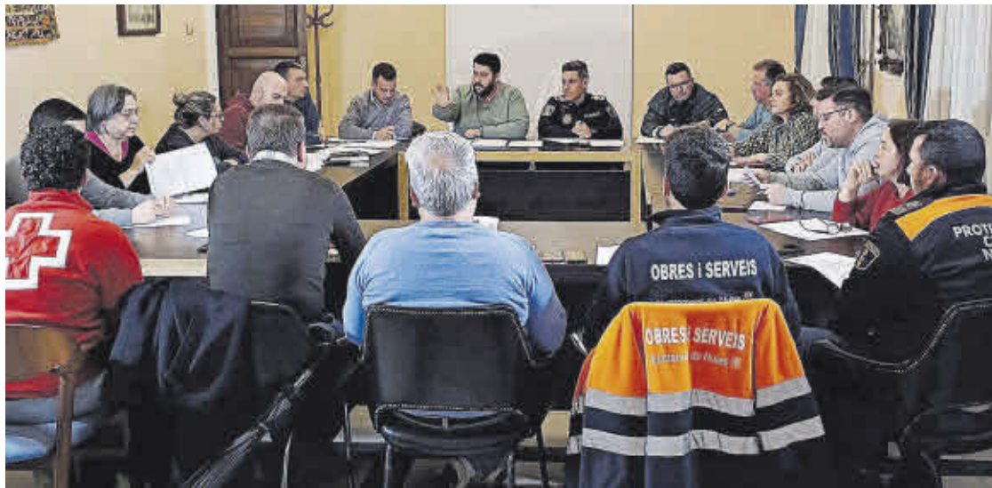
Una de les reunions que va mantindre el Cecopal durant el darrer episodi de pluges a la província de Castelló.

Es va habilitar el Local Multifuncional per a albergar, si fora el cas, a persones que hagueren d'abandonar les seues cases; es van doblar els torns de la Policia Local; i es va recomanar suspendre l'activitat comercial i industrial no indispensable. També es va decretar per al dia 4 el nivell de preemergència per risc d'inundacions, així com les mesures recollides al Pla d'Actuació Municipal davant el