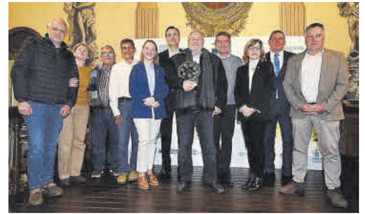
Una amplia representación de la asociación recogió el galardón en Vila-real.

La Asociación para la Diferenciación de la Clemenules de la Plana recibió el galardón de Innovación en los I Premios Agrícolas de Castellón por la marca de calidad Nuleta. El reconocimiento fue entregado el 11 de marzo en el salón de actos del Sindicat de Regs de Vila-real.