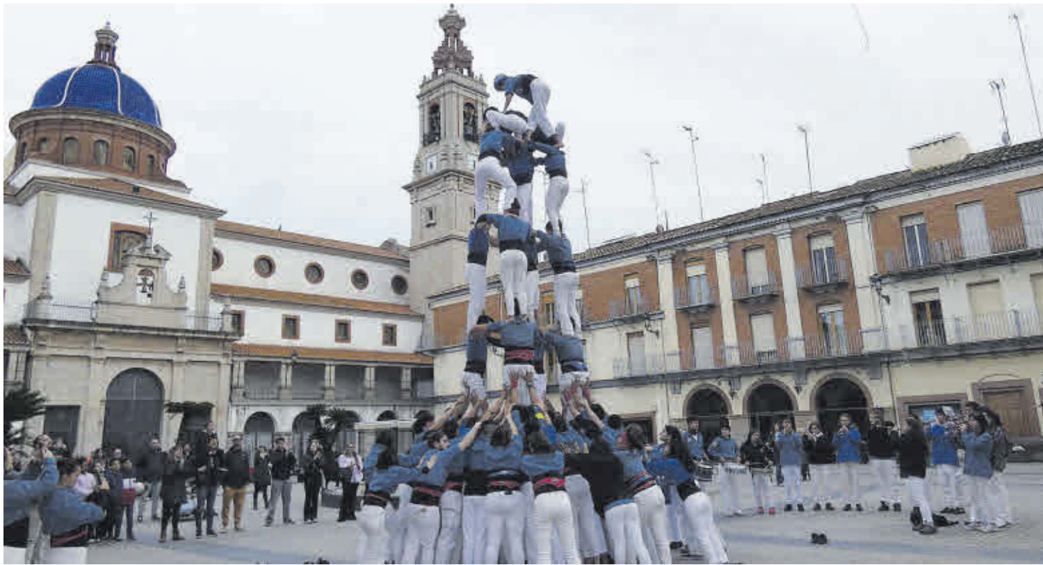
Els membres de la Colla Castellerà Ganàpies de la Universitat Autònoma de Barcelona (UAB) van protagonitzar els moments més espectaculars de la jornada.