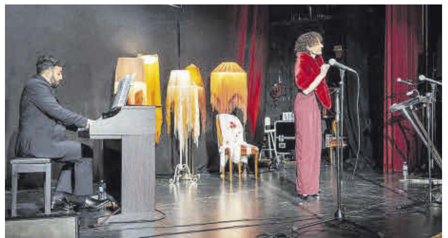
La programació del 8M va concloure amb el concert 'Las damas de Sottovoce'.