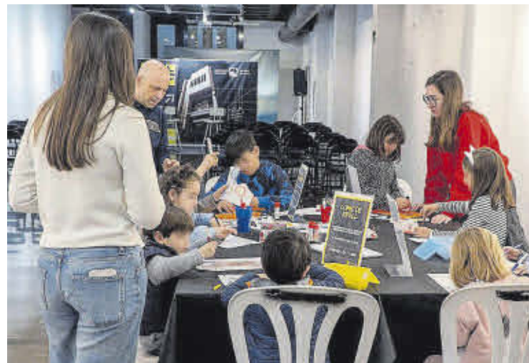
Els més menuts van gaudir amb l'activitat 'Cómo ser un buen detective'.