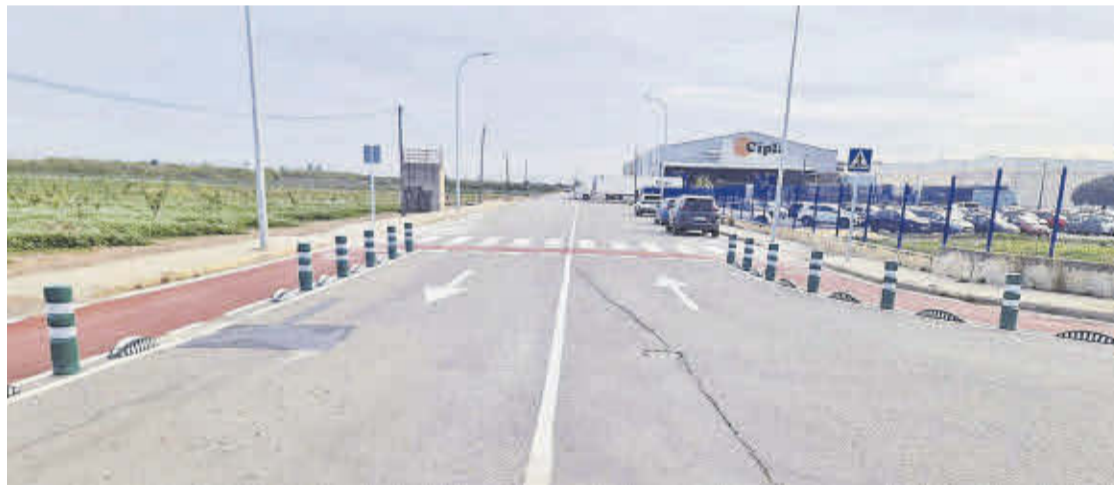
Una dotació de l'Ivace de 200.000 euros ha permés actuar al polígon industrial Polar.

En concret, al polígon industrial de Cardanelles s'ha desenvolupat un projecte de millora d'infraestructures amb un pressupost de 116.000 euros, i que contempla la creació d'una