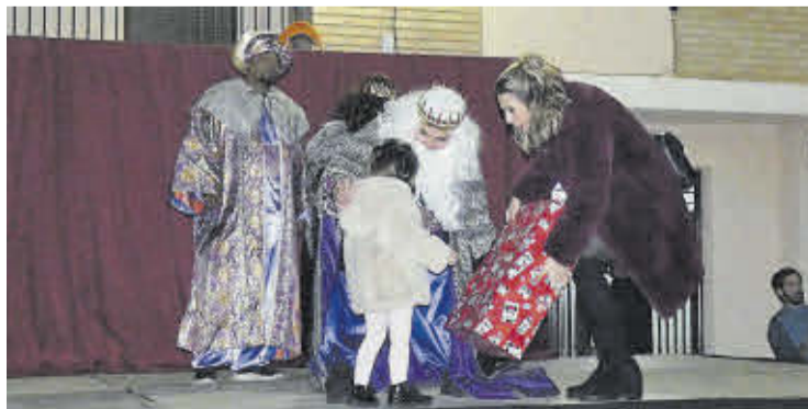
Els Reis Mags també van portar regals als xiquets i xiquetes de Mascarell.