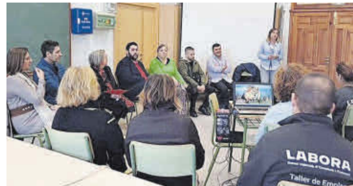
L'alcalde i la regidora d'Ocupació van assistir al lliurament de certificats.

Un total de 30 persones desocupades de Nules van rebre el certificat de professionalitat en les especialitats de Fusteria, Jardineria i d'Obra. En concret, es tracta de l'alumnat del Taller d'Ocupació Nules IX que al llarg d'un any s'ha format amb l'objectiu de millorar la seua ocupabilitat.