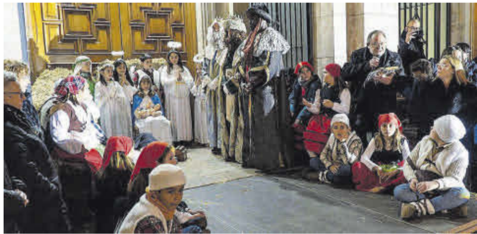
En el belén vivent situat a la plaça Major es va representar el naixement de Jesús.

Centenars de xiquets i xiquetes van gaudir amb una cavalcada que per segon any consecutiu va tindre caràcter inclusiu