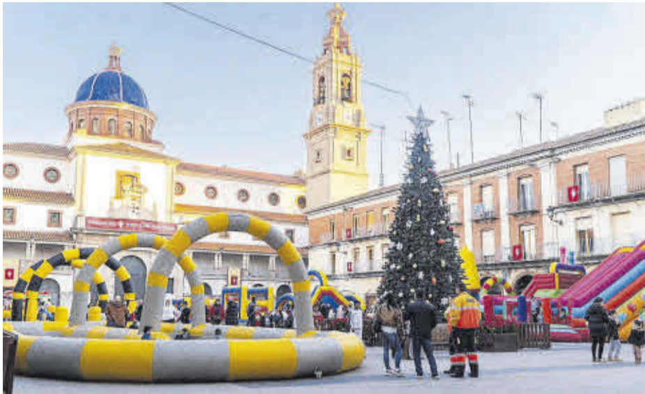
La plaça Major del municipi es va tornar a convertir en un parc d'atraccions per als més joves.