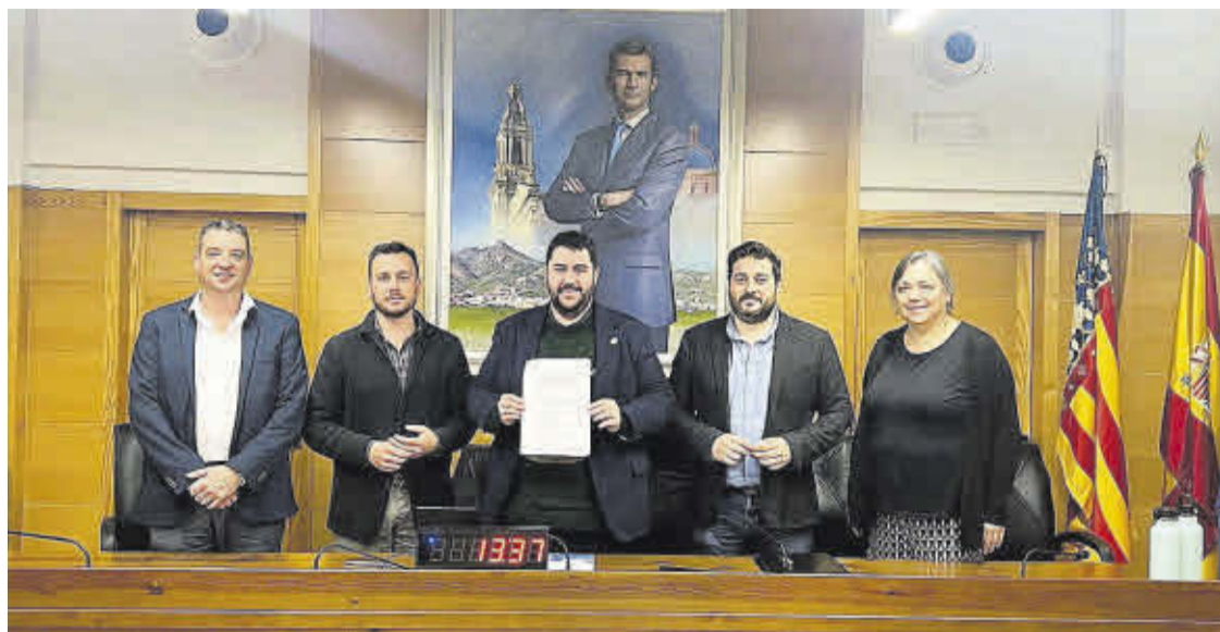
Tots els grups municipals de Nules van donar suport a la iniciativa solidària amb la població de Picanya.