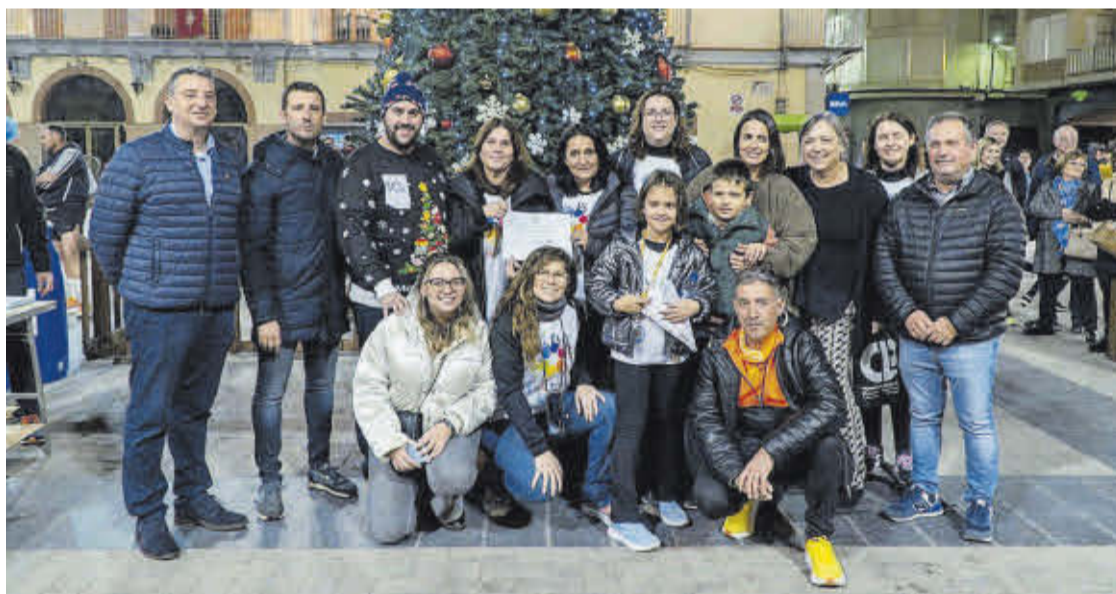
Els representants de l'Ajuntament i el Club Atletisme Noulas van posar amb les responsables de l'associació Sentim.