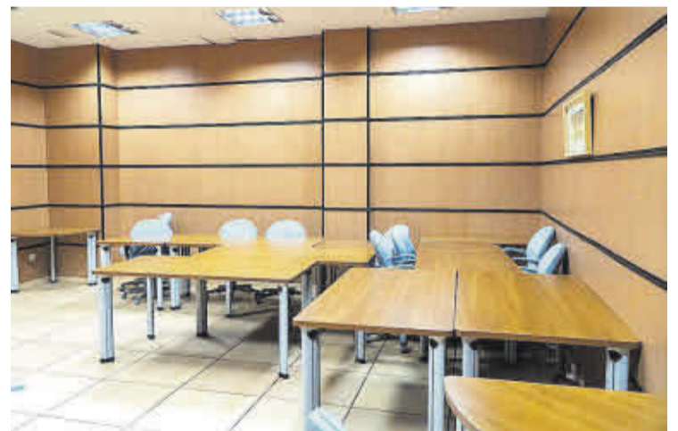
Una de les sales actuals de la coneguda com a Casa dels Alemans.