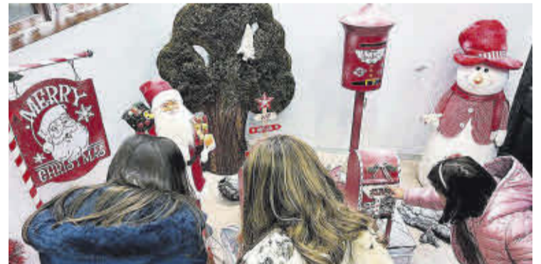
Els més joves van gaudir amb la decoració de la Casa del Pare Noel.