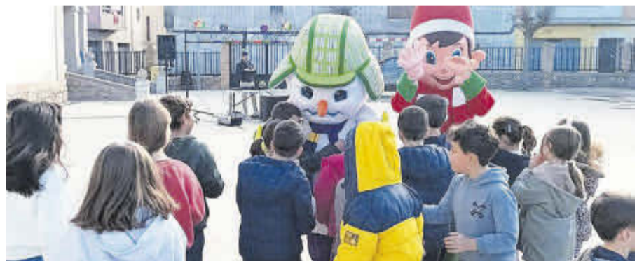
Els participants en l'Escola de Nadal al CEIP Cervantes van rebre visites inesperades.