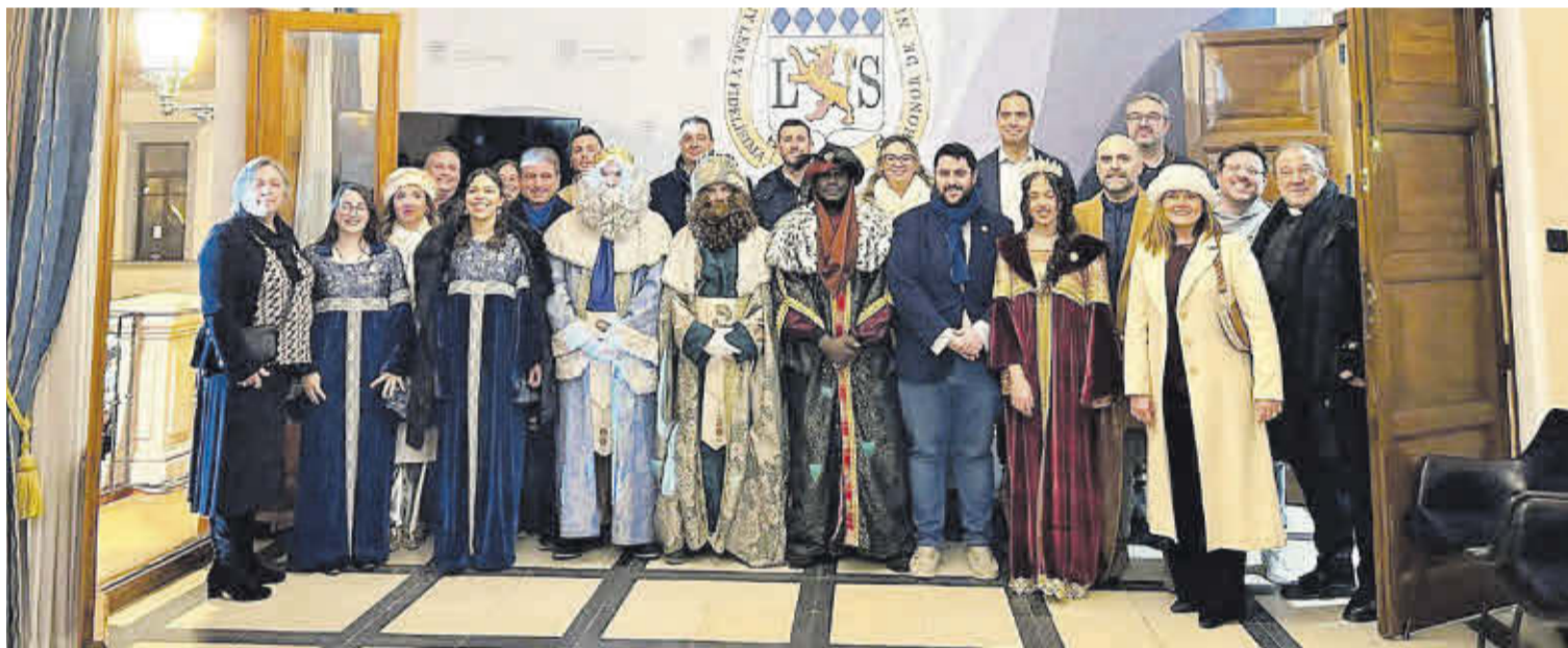
Els Reis Mags van immortalitzar el seu pas per Nules amb una foto de família amb els membres de la corporació municipal.

A més, el matí del 6 de gener, els Reis Mags van visitar la residència de la Mare de Déu de la Soledat.