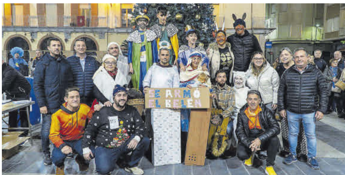
Aquest grup d'amics disfressats com un belén vivent van guanyar el premi a la millor disfressa.