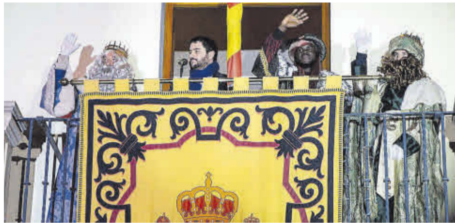
Els Reis Mags van saludar als nulers des del balcó de l'Ajuntament i van rebre la clau del municipi.

E ls Reis Mags d'Orient van arribar a Nules el passat diumenge 5 de gener davant la mirada d'il·lusió de centenars de xiquets i de xiquetes. Melcior, Gaspar i Baltasar van desfilat amb carrosses pels principals carrers del casc urbà del municipi saludant així els més menuts i les seues famílies.