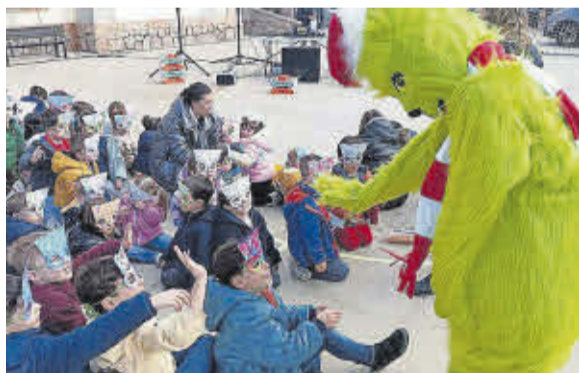
El Grinch va visitar als alumnes de l'Escola de Nadal.