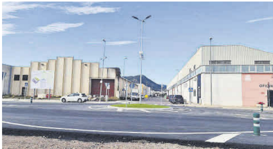
Les actuacions realitzades al polígon de Cardanelles han tingut un pressupost de 116.000 euros.

Les actuacions que s'han realitzat a les zones industrials han comptat amb el recolzament financer de l'Ivace de la Generalitat