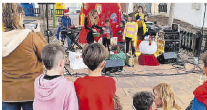
El Nadal a la Mar ja s'ha convertit en una cita tradicional d'aquestes festes.