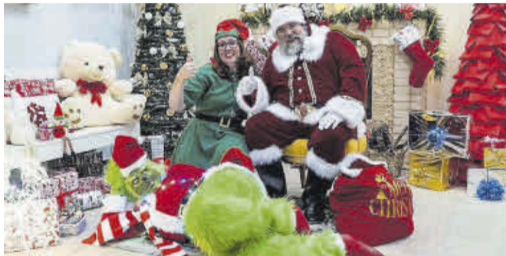
La Casa del Pare Noel, a l'antiga Cambra Agrària, va oferir moltes sorpreses.

Diverses formacions i col·lectius van oferir concerts o actuacions, mentre que l'Escola de Nadal va comptar amb 185 xiquets i xiquetes. El CEIP Cervantes va acollir les activitats, com la festa del pre Cap d'Any el 31 de desembre amb el repartiment de Nuleta. La regidoria d'Infància també va organitzar tallers, jocs i cinema.