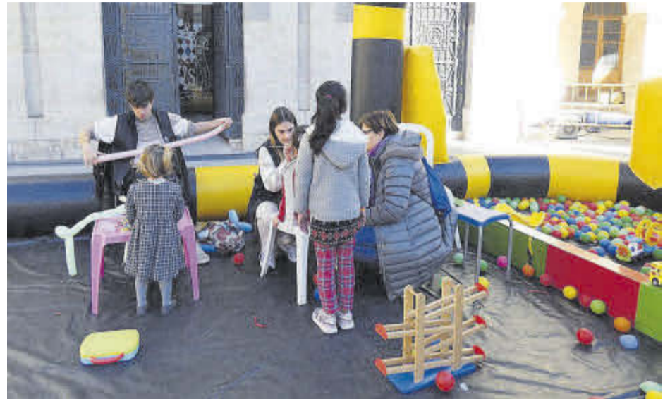
Els xiquets i xiquetes van poder participar en tallers i jugar en el Nadal a la Plaça.