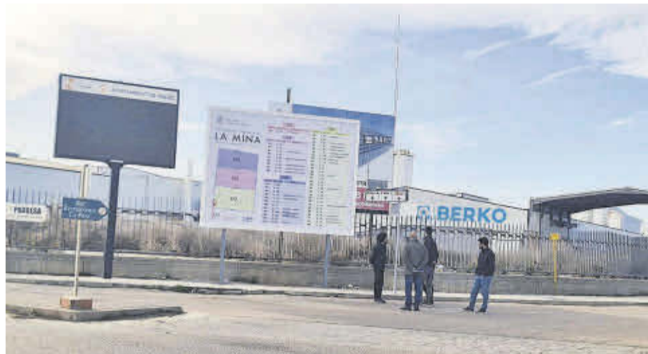
En la Mina s'han invertit 200.000 euros per a portar a terme diverses millores.

Es polígons industrials de Cardanelles, la Mina i Polar de Nules han millorat les seues instal·lacions amb unes actuacions amb les quals se'ls ha dotat de noves infraestructures tecnològiques i de serveis, amb l'objectiu de modernitzar aquestes zones industrials del municipi.