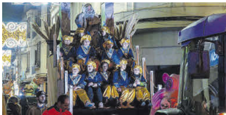
Els tres Reis Mags van recórrer el municipi acompanyats de joves patges.