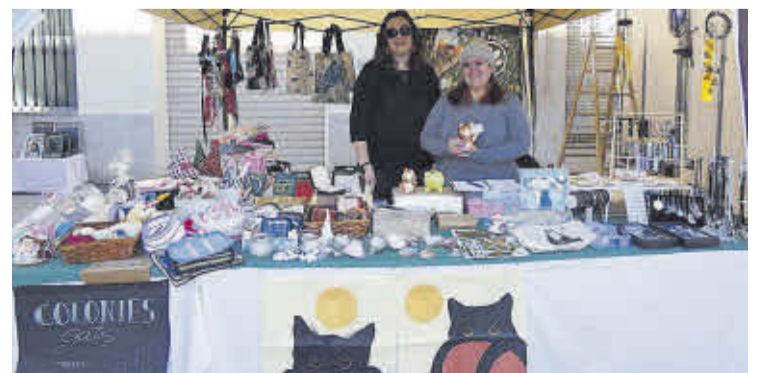
L'Associació Colònies Gats Nules va participar en el Nadal Animal.