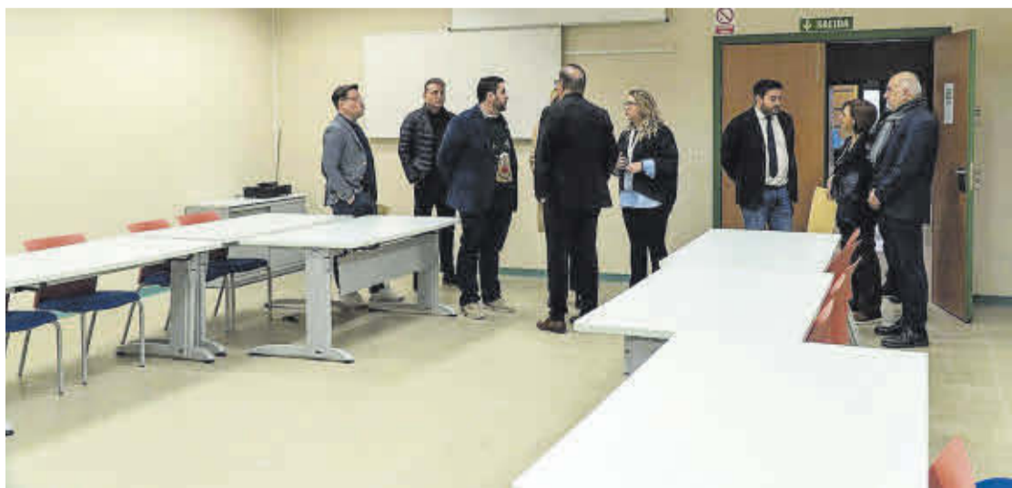
L'acte de cessió de l'immoble va incloure una visita a les instal·lacions actuals de l'edifici.