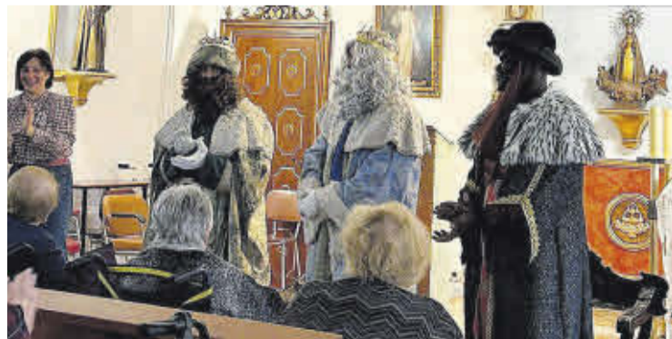
El 6 de gener els Reis Mags van visitar la residència Mare de Déu de la Soledat.