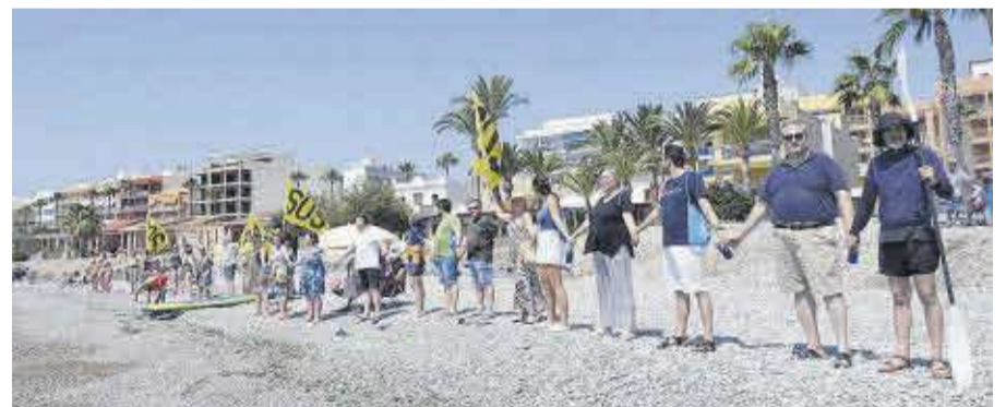
Els veïns i veïnes van formar una cadena humana per a reivindicar la regeneració de les platges.