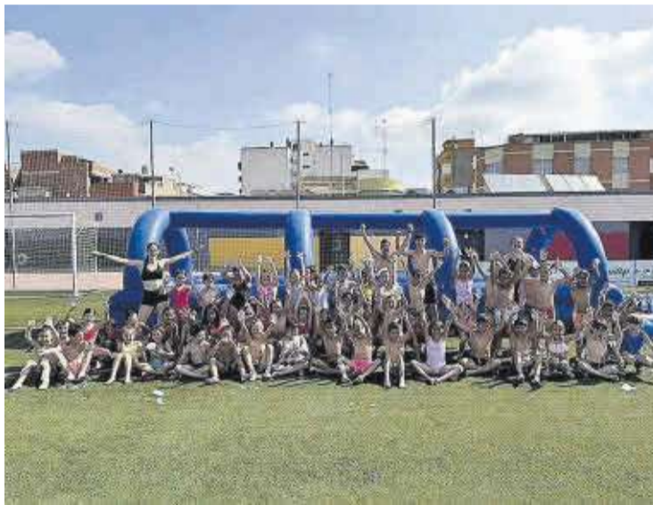
Els xiquets i xiquetes que han participat en l'Escola Esportiva d'Estiu han pogut practicar moltes activitats tant a l'aire lliure com a instal·lacions interiors.

A més, del 15 al 19 de juliol, es va celebrar de nou el campament d'estiu al Centre de Natura Tarihuella de Jérica, on 34 xiquets i xiquetes van realitzar activitats esportives.