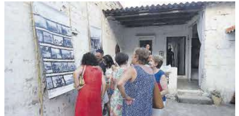
La Caseta de Lluís Casaus va acollir la mostra fotogràfica '100 anys a vora mar'.