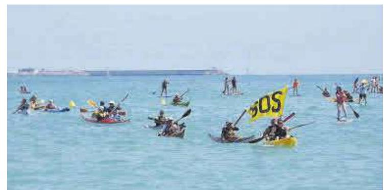
La travessia de caiacs i paddle-surf va tindre una gran participació.