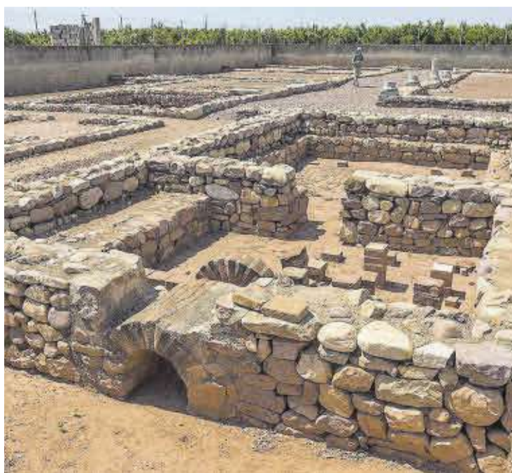
Nules podrà traure a la llum tot el jaciment romà de Benicató.

El projecte, de caràcter plurianual i amb vista a la seua finalització l'any 2027, consta de tres fases: una primera de treballs arqueològics, on es pretén traure a la llum la totalitat del jaciment; la segona consisteix en la restauració del mateix jaciment i la seua interpretació, i la tercera serà la creació d'un museu en el mateix jaciment que arreplegue, a més de les peces trobades en les excavacions arqueològiques de gran valor patrimonial, una contex-