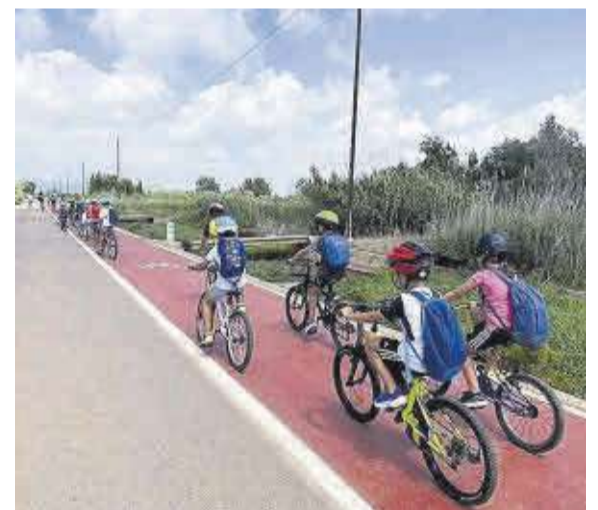
El ciclisme va ser una de les disciplines de l'Escola Esportiva.