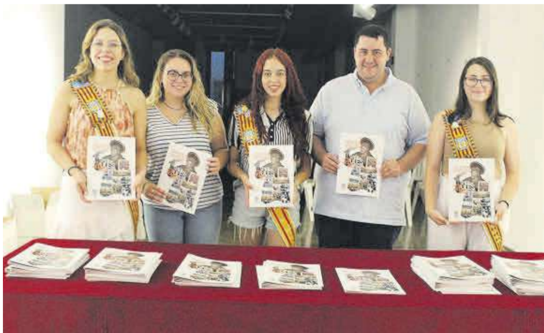
La nova cort d'honor va repartir el programa de les festes juntament amb l'alcalde i la regidora de Festes.

Fins al 16 d'agost es podrà gaudir d'una variada programació amb actes per a tots els públics, de fet els més menuts podran gaudir també de tallers, jocs i d'un parc aquàtic infantil al carrer Illes Columbretes. De la mateixa manera que, també se celebraran de nou els tradi-