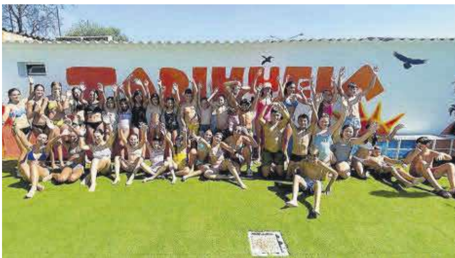
Un total de 34 joves van participar en el campament d'estiu al Centre de Natura Tarihuella.