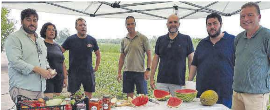
NULES POSA EN VALOR ELS SEUS PRODUCTES DE MARJAL AMB EL PRIMER TALL

Des de la regidoria d'Agricultura i Medi Ambient es considera vital seguir col·laborant i unint esforços per part de les dos entitats per a millorar