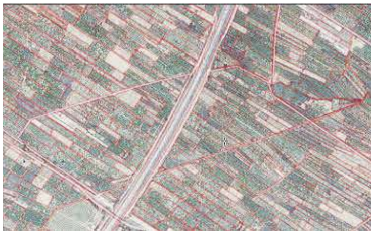
Parcel·lari característic de minifundi corresponent a Nules.

El projecte comença amb l'adquisició de finques i la presentació d'ajudes per al Pla de reconversió i reestructuració col·lectiu 2024 de la Cooperativa Agrícola Sant Josep a l'Agència Valenciana de Foment i Garantia Agrària. També es contempla un conveni amb l'empresa AMC Fresh per a