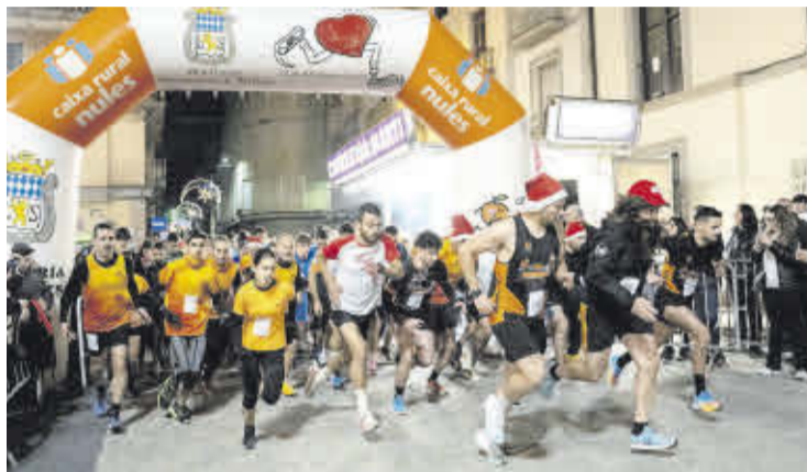
La Sant Silvestre de Nules va tornar a tindre una gran participació.

La cursa també va destacar per les colorides i divertides vestimentes de molts dels partici-