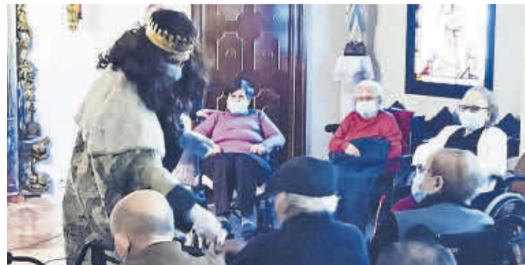
També van portar regals a la Residència Mare de Déu de la Soledat.