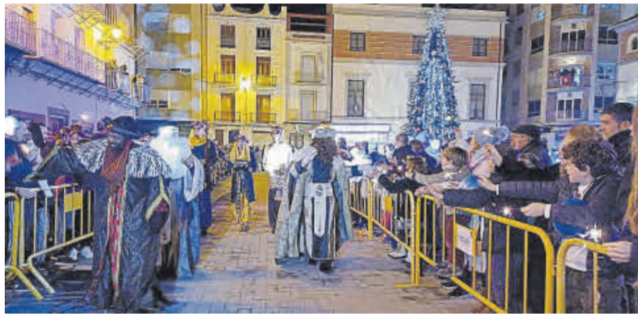
Els Reis Mags saluden el públic de Nules en arribar a la plaça Major del municipi.

Ses Majestats d'Orient van desfilat pels carrers de la població davant la mirada de centenars de xiquets i xiquetes del municipi