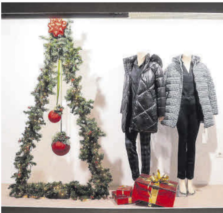
Tercer premi concurs de decoració nadalenca d'aparadors: Mados Store.