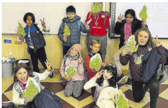
Els més menuts han disfrutat amb l'Escola de Nadal.