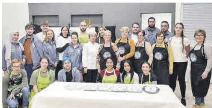
Una de les noves propostes d'enguany ha sigut el Taller de Galetes Nadalenques.