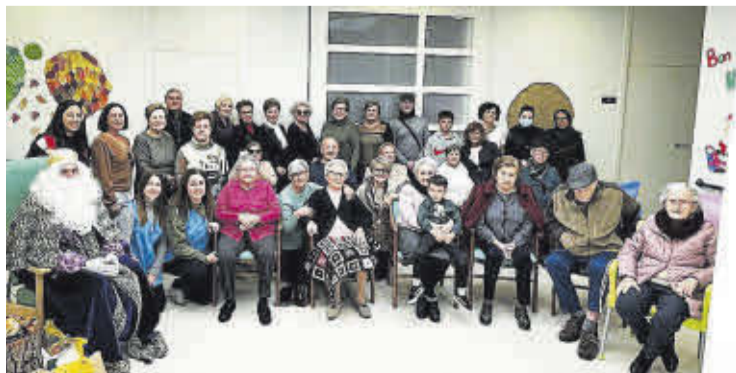
Els Reis Mags van visitar el Centre Respira i Alzheimer amb la Coral del CEAM.