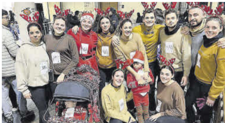
Un grup d'amics vestits de rens va guanyar el premi a la millor disfressa.

pants. I és que de nou hi havia premi per a la millor disfressa col·lectiva, que enguany va ser per a un grup d'amics que representaven un trineu nadalenc tirat per rens.