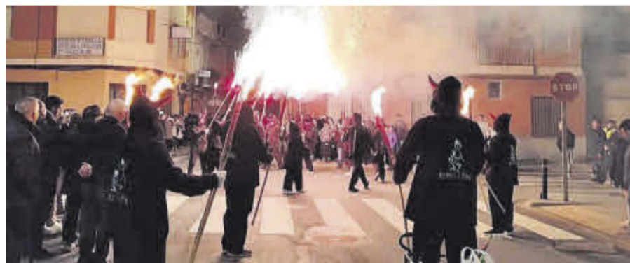
Els Dimonis del Poll van participar per primera vegada en la Cavalcada de Reis.