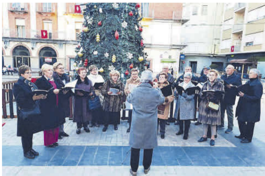
La Coral Veus de Cor del CEAM va cantar nades al Convent i pels carrers del municipi.