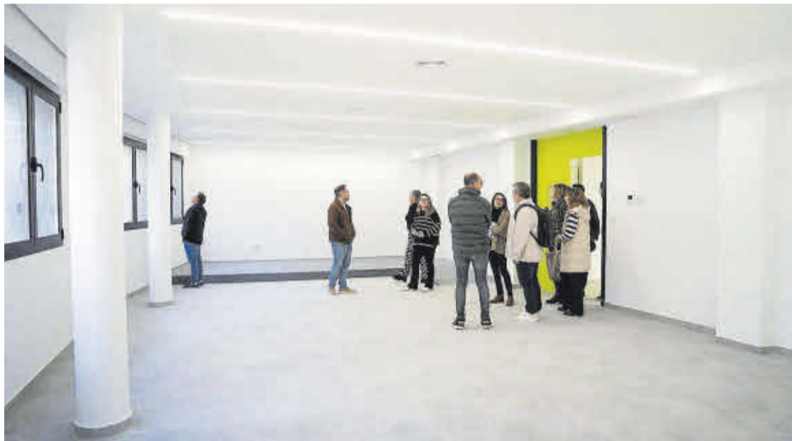
Una delegació de l'equip de govern va visitar les obres del Casal Jove juntament amb els seus responsables.

Per altra banda, s'ha dotat l'edifici d'accessibilitat universal amb una passarel·la interior en rampa que connecta els dos