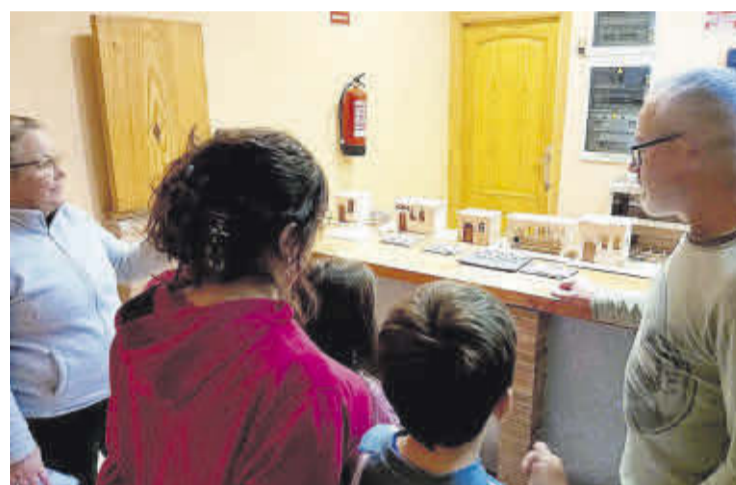
La Corretjola i l'Ajuntament van organitzar el primer Taller de Betlemisme.