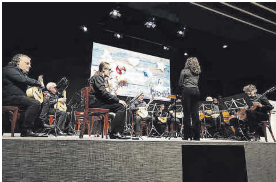
L'Orquestra Laudística Daniel Fortea va oferir el seu concert de Nadal al Saló de la Caixa Rural.