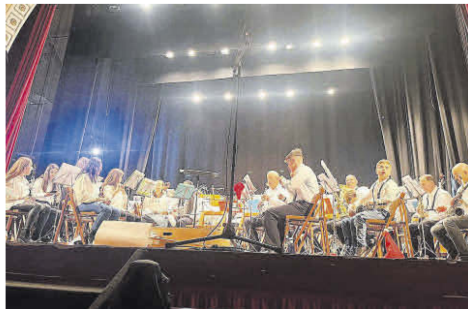
El Teatre Alcázar va acollir el concert de Nadal de la Banda de l'Associació Musical Artística Nulense.