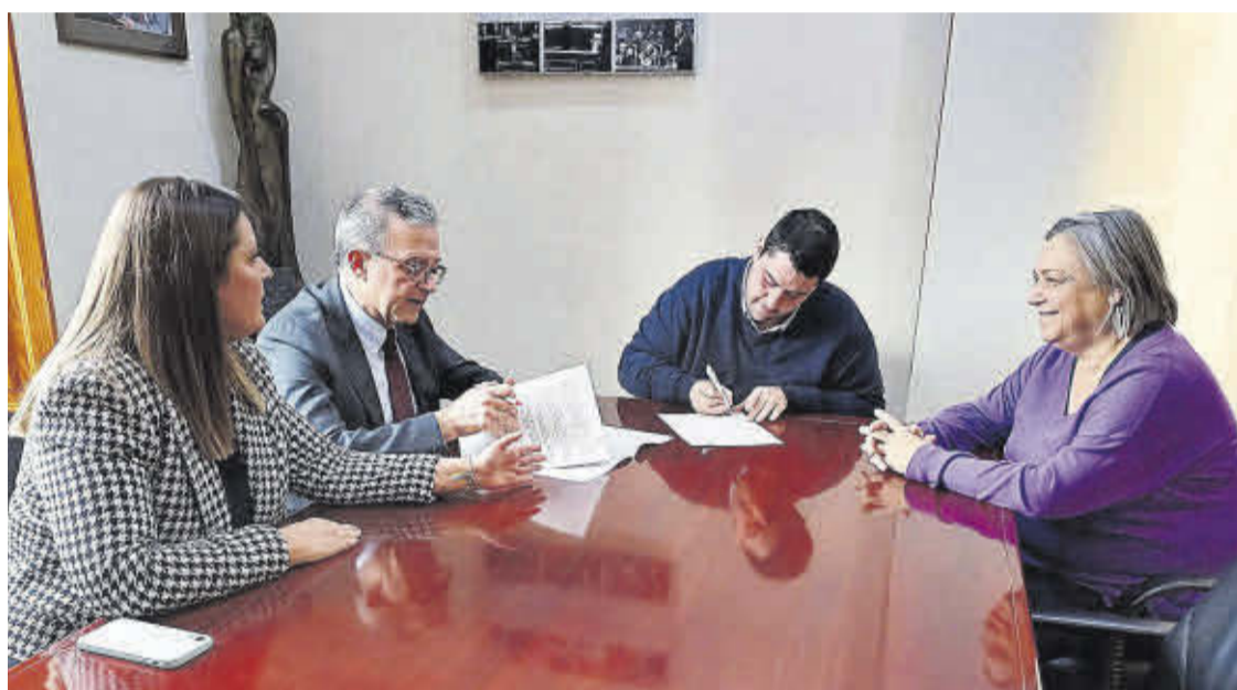
L'alcalde i el secretari autonòmic d'Ocupació i director general de Labora van signar el nou conveni.