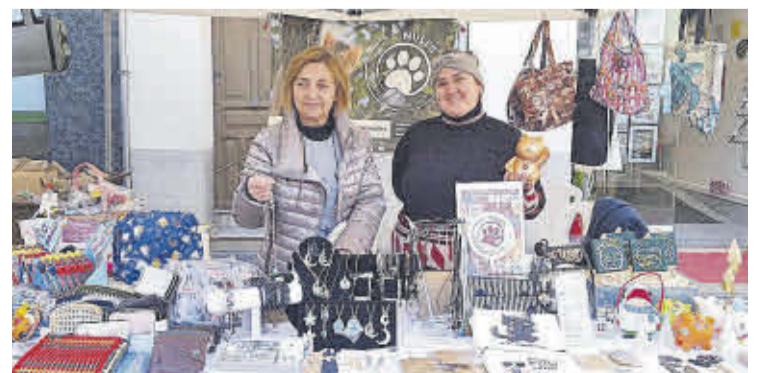
Colònies Gats Nules va tornar a participar en el mercadet solidari del Nadal Animal.