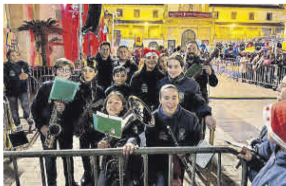
Membres de la Banda Juvenil de l'Associació Artística Nulense.