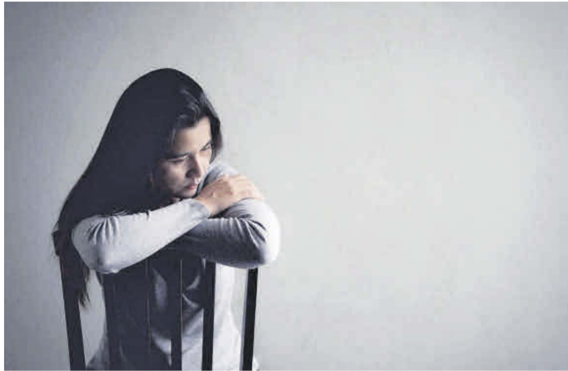
Una mujer reflexiona después de haber sufrido la pérdida de un ser querido.