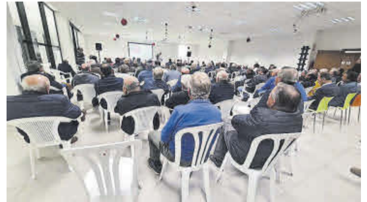
La Cooperativa Agrícola va acollir la reunió del Sindicat Central de Regs.

També es repartiren Nuletes per al Pre Cap d'Any. Així, en la Clemen Nit Festa el consistori va repartir galls de taronja i productes fets amb clemenules com ara suc, aigua de València o dolços fets per les Ames de Casa, Cantalobos i Ashotur.