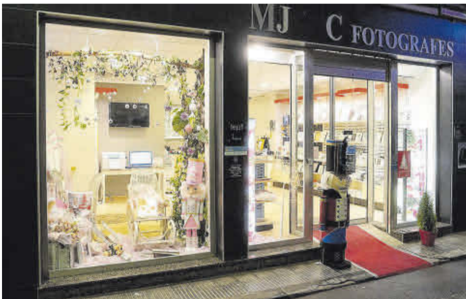
Primer premi concurs de decoració nadalenca d'aparadors: MJ & C Fotògrafes.