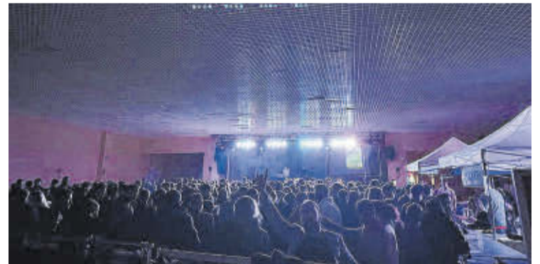
El Saló Multifuncional va acollir actuacions musicals en les principals festes.