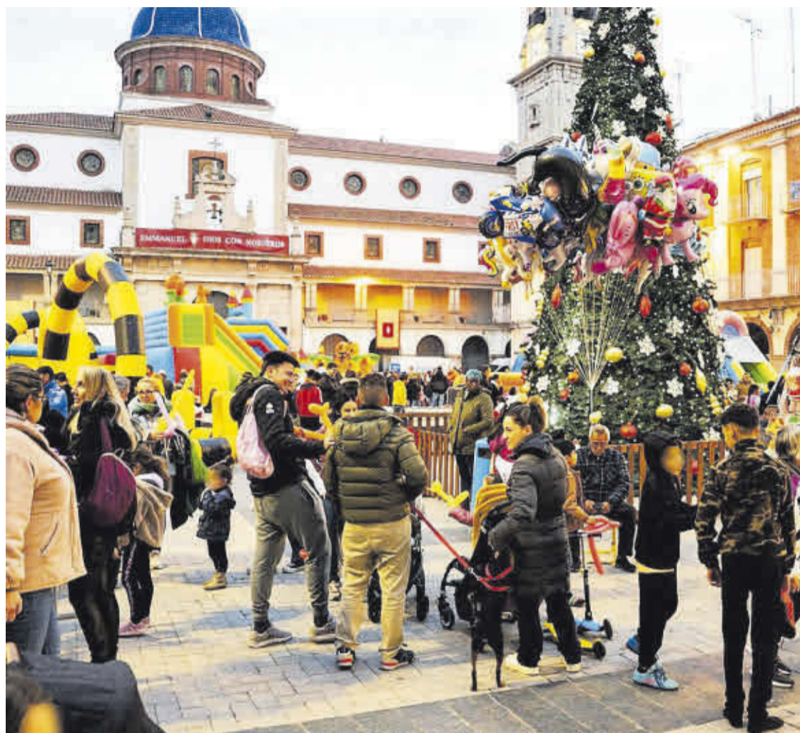
La Fira de Nadal a la plaça Major va tornar a garantir la diversió, i a més va ser solidària per a l'associació ESTEM.