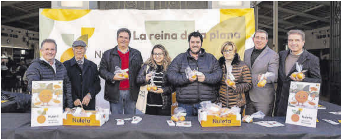
Els representants de l'Ajuntament, la Cooperativa Agrícola i la Caixa Rural van repartir Clemenules al Mercat Municipal.

En la Clemen Nit Festa també es van repartir galls de taronja i productes fets amb clemenules