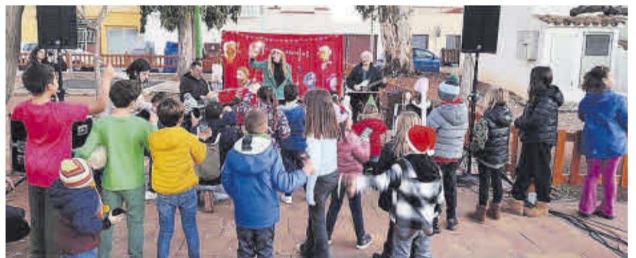
El Nadal a la Mar s'ha consolidat com una nova proposta per a les festes més especials de l'any.