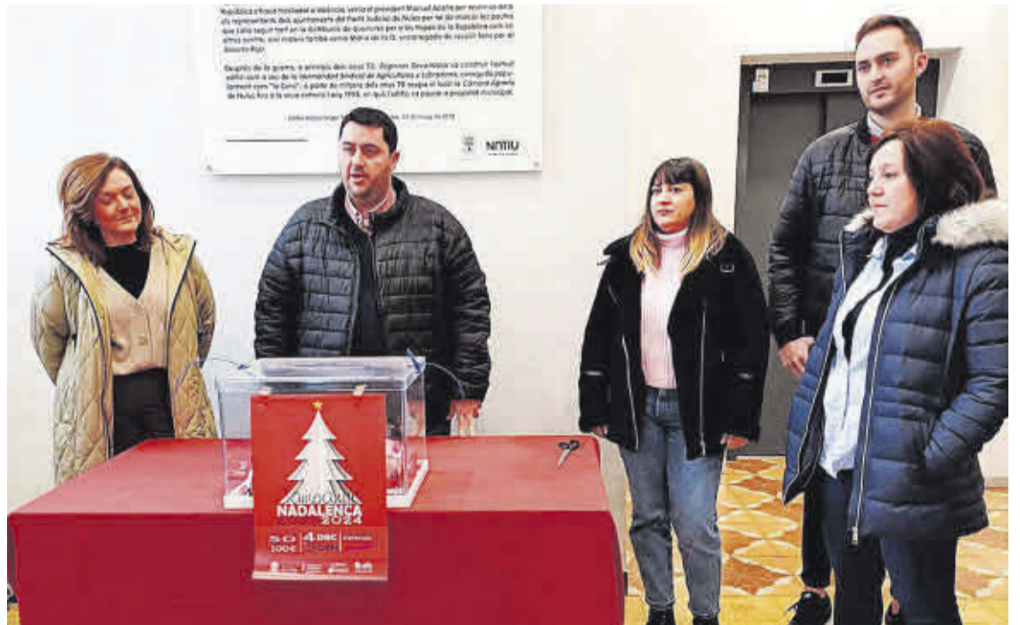
L'alcalde, la regidora de Comerç i representants dels comerços van sortejar el viatge a Disneyland París i els 50 vals de 100€.