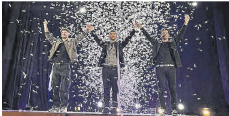
La programació nadalenca es va tancar amb un espectacle de màgia.

A més, es van celebrar l'Escola de Nadal, l'Escola Esportiva i Nadal Jove; i es van programar activitats per a dinamitzar el comerç local.