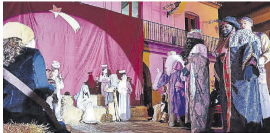
Davant de l'ajuntament es va representar l'Adoració amb un pesebre vivent.

E ls Reis Mags d'Orient van arribar a Nules el passat 5 de gener davant la mirada d'illúsió de centenars de xiquets i xiquetes. Melcior, Gaspar i Baltasar van desfilat amb carrosses pels principals carrers del casc urbà del municipi saludant així els més menuts i les seues famílies.