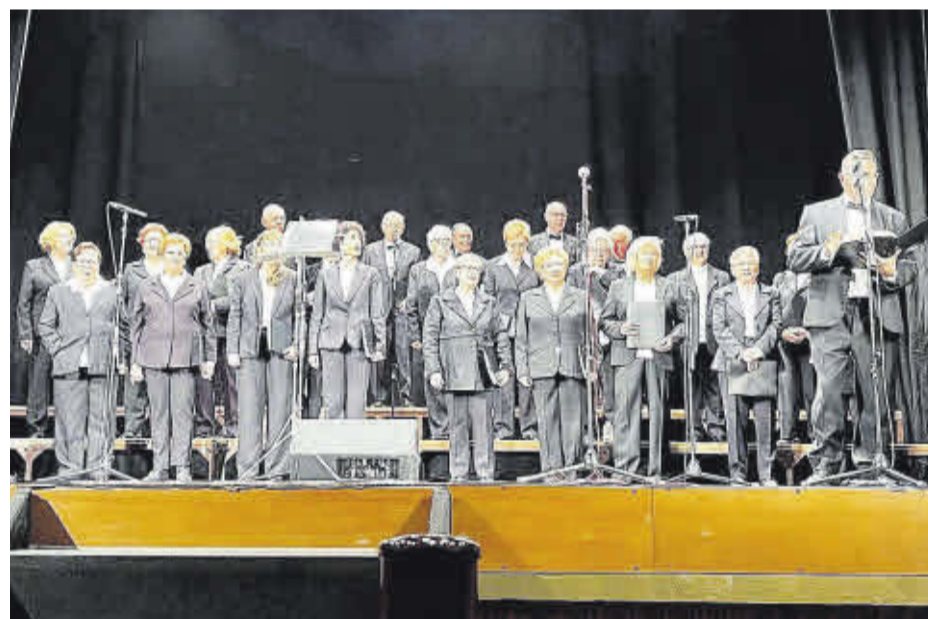
Els veïns també van poder gaudir amb les nades de la Coral Sant Bartomeu al Teatre Alcázar.