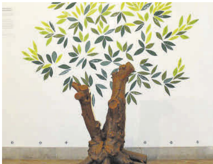
Una de les obres de la mostra, a partir de la primera soca de clemenules.

que van formar part de la mostra Diàlegs culturals , en la qual també es van exposar els dibuixos guanyadors d'aquesta primera edició.