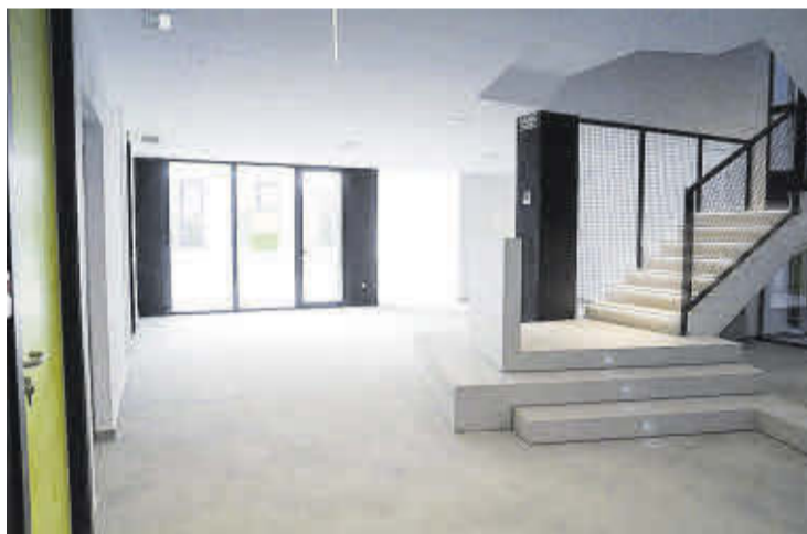
Les instal·lacions s'han renovat per complet per a una millor funcionalitat.