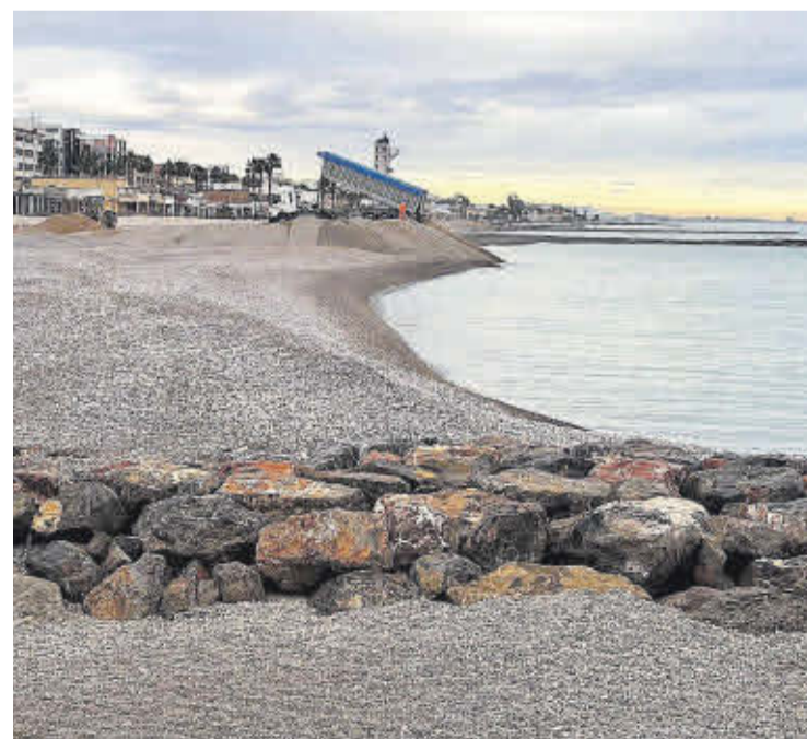
Les obres en la costa de Nules continuen desenvolupant-se a bon ritme.

Amb tot, Esteban assenyala que la imatge del litoral de Nules ha canviat per complet amb aquestes actuacions i que seguiran reivindicant la regeneració de les zones pendents com ara la platja de l'Alcúdia, la zona nord de la platja Bovalar, la zona sud de la platja de les Marines i la platja Rajadell «per a que la regeneració siga integral en totes les nostres platges».