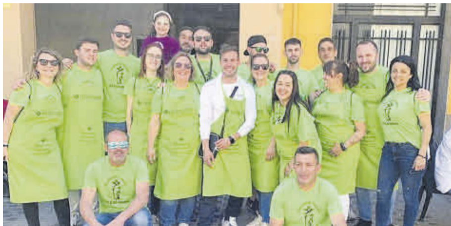
L'entitat ha col·laborat amb les festes dels barris, com és el cas de les d'El Salvador.