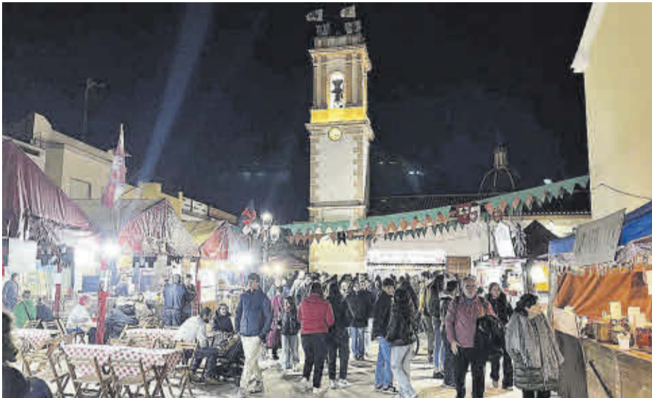
Els visitants passegen per la zona de gastronomia la nit de la inauguració.