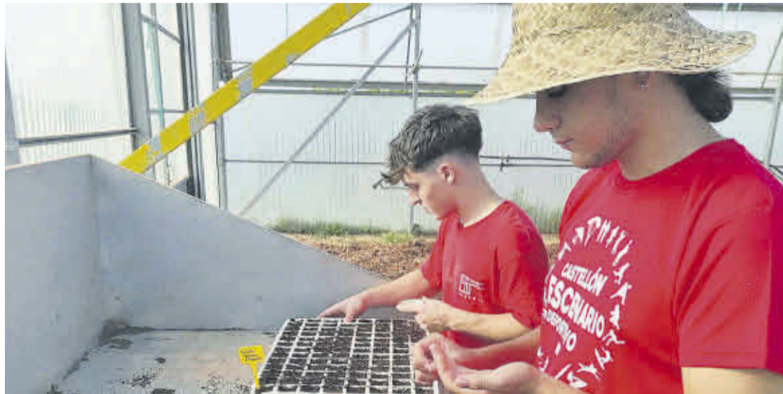
Dos alumnes de la FPB d'Agrària de l'IES Gilabert de Centelles de Nules.

El projecte que l'IES Gilabert de Centelles emprén des del 2018 passa també als CEIPs este any