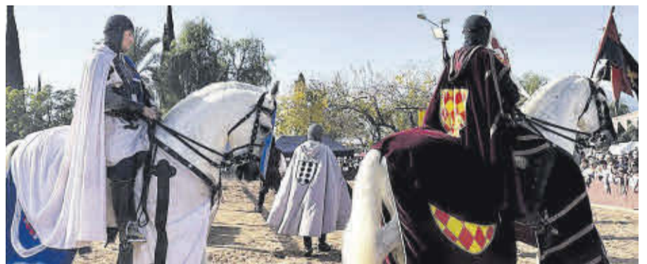
Dos homes caracteritzats com a cavallers munten els seus cavalls.