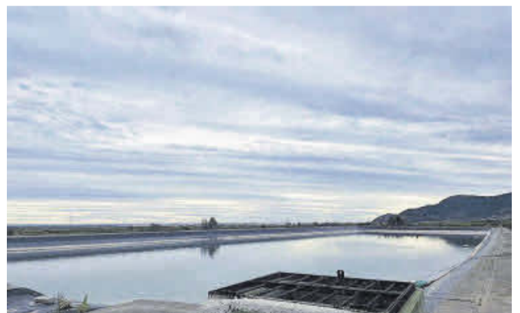
Els regants veuen bonificades part de les compres anuals a la Cooperativa.

La Cooperativa Agrícola Sant Josep de Nules té contabilitzades a un total de 14 societats de