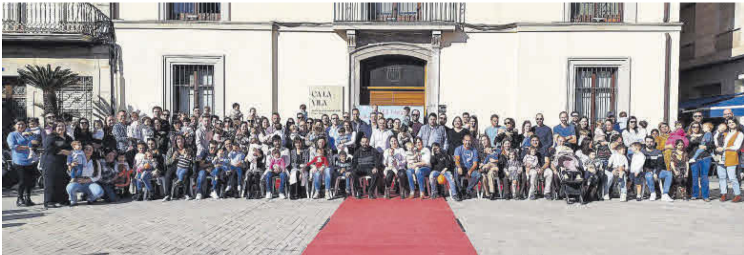
La foto de família amb tots els convidats que van participar en l'acte Benvinguda al Nuleret i Nulereta, a la plaça Major de la localitat.