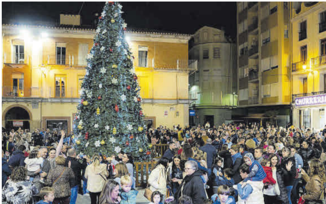
El moment de l'encesa de l'arbre a la plaça Major, amb centenars de persones reunides.

En aquest sentit, entre les principals accions que formen part d'aquesta campanya cal destacar la recuperació del pasaport, de manera que per a participar hi haurà que omplir el mateix amb 10 segells de dife-