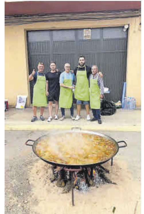
Ruralnostra, present en les celebracions de Nules.