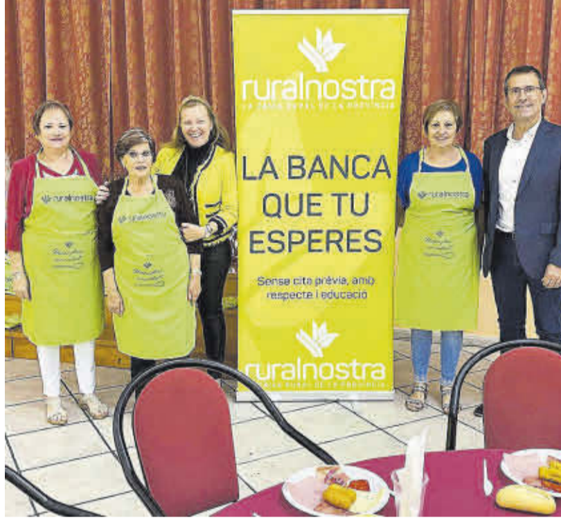
Ruralnostra va col·laborar amb el popular Dia de la Cassoleta de les Mestresses de Casa.