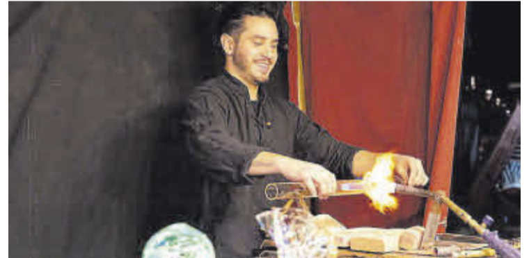
Un dels participants a la Fira realitzant el seu ofici artesanal.