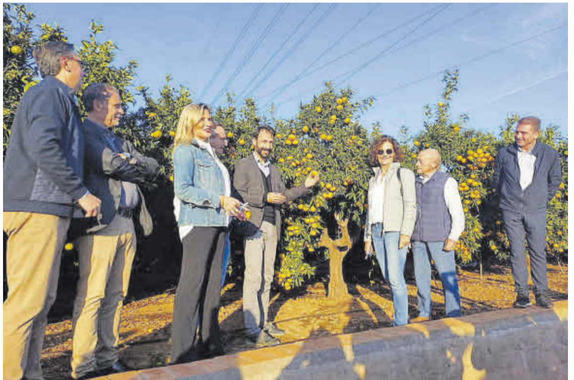
L'instant concret en el que es va produir el primer tall de la Nuleta per part de les autoritats presents.

Cal recordar que l'Associació per a la Posada en Valor de la Qualitat de la Clemenules de la comarca de la Plana es va constituir formalment l'any 2021 i està formada pels ajuntaments d'Almassora, Moncofa, Betxí, Borriana, la Vall d'Uixó, la Vilavella, Nules, Vila-real, les Alqueries, Artana, Castelló, Onda i la Llosa, l'Associació de Pous i el Sindicat de Regs del Millars, juntament amb la Caixa Rural de Nules, diverses cooperatives agrícoles i comerços.