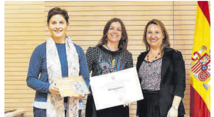
La delegació del CEIP Lope de Vega rep el premi entregat a Madrid.

L'alumnat de la FPB d'Agrària acompanya als col·legis de Nules en la creació i manteniment de l'hort escolar. S'emfatitza en la importància d'obtenir de nou llavor en finalitzar el cicle per a ser autosuficient en les següents temporades, entenent la importància de ser autosuficients a més de recuperar sabers i sabors que acompanyen a varietats tradicionals. *Departament d'Agrària de l'IES Gilabert de Centelles