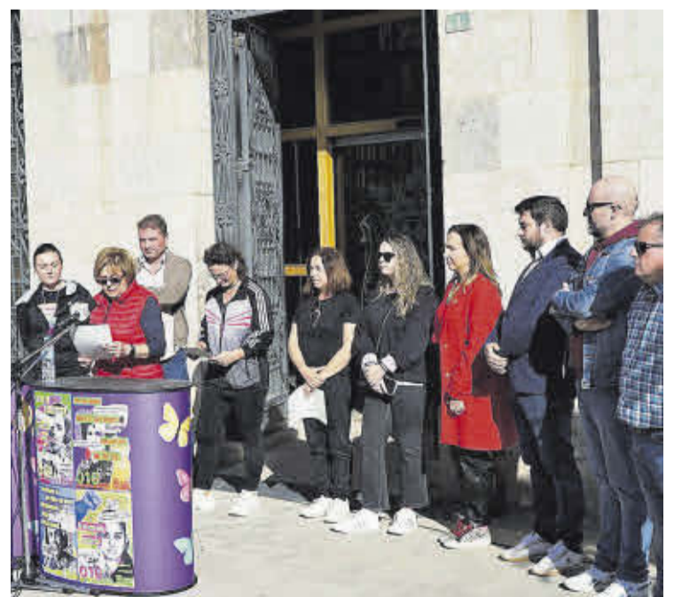
Lectura del manifest del Dia Internacional contra la Violència de Gènere a Nules.

«Hi ha que educar des de menuts en valors com ara el respecte, inclusió, sororitat, empatia, acceptació, valentia, llibertat, integració, tolerància, responsabilitat, feminisme o empoderament per a fer front a aquesta xacra de la societat, i des de les institucions públiques hem de treballar per a que aquestes accions tinguen lloc al llarg de tot l'any i no sols en aquestes dates», va recalcar.