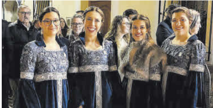
La cort d'honor de Nules va participar en la fira amb vestits d'època medieval.

La Fira Medieval de Mascarell, celebrada ja durant setze edicions, ha anat evolucionant de manera exponencial fins a convertir-se en tot un referent autòmic i nacional, amb molts visitants de fora de la comunitat autònoma.