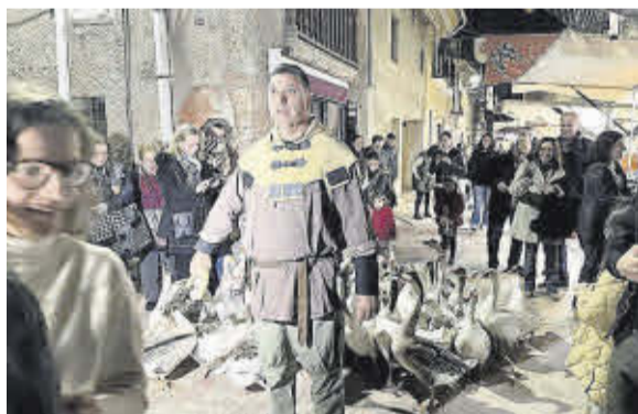
Les oques van divertir als més xicotets.