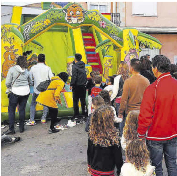
Xiquets i xiquetes fan fila per a muntar-se en un dels unflables instal·lats.