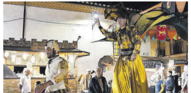
Un animador realitza un dels múltiples espectacles amb actors.