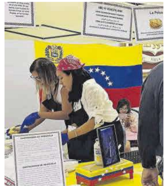
Dos dones preparen arepes veneçolanes.