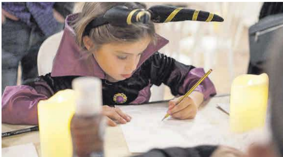
Una xiqueta disfressada per Halloween fa un dibuix durant una de les activitats de la jornada.

Així mateix, davant l'èxit de l'edició anterior es va fer una nova Ruta de Llegendes Valencianes per la Nit d'Ànimes , que va transcórrer per diferents carrers del municipi i va comptar amb els