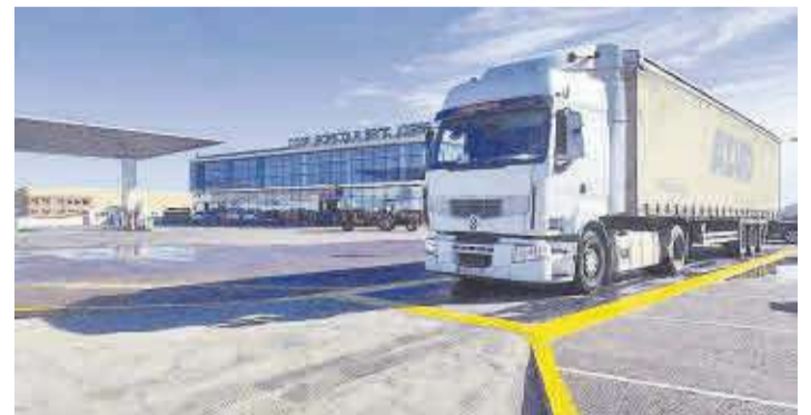
Un vehicle pesat utilitzant la nova instal·lació al costat de la Cooperativa.

La població compta també amb el Consell Ambiental Educatiu de Nules, des del qual s'implica a la comunitat educativa i als centres en projectes mediambientals.