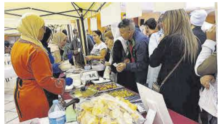
Molta gent espera els seus plats a la paradeta de menjar del Marroc.