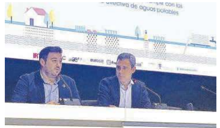
Una de les ponències de la jornada que va tindre lloc a la Caixa Rural.

■ L'Ajuntament de Nules, amb la companyia Facsa, va organitzar el 27 d'octubre la jornada Soluciones verdes per al tractament d'aigües subterrànies contaminades per a complir amb els estàndards de la directiva d'aigües potables .