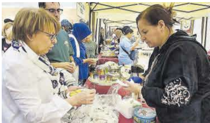
Una de les participants ven dolços a una visitant de la Trobada Gastronòmica.