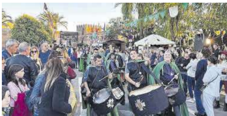
Una de les anteriors edicions de la Fira Medieval de Mascarell.

Les noves dates per a la celebració d'aquesta esperada XVI edició de la fira seran els dies 24, 25 i 26 de novembre. «La decisió ha estat complicada, però en aquestes situacions hi ha que prevaldre la seguretat»,