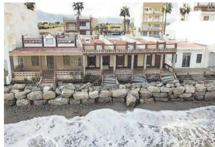
L'aigua, a pocs metres de les cases i el mur protector al litoral de Nules.

El regidor, César Estañol, va recalcar que «és el primer pas per a que en el futur es puguen beneficiar d'aquestes instal·lacions, gràcies a la modalitat d'autoconsum col·lectiu, més consumidors del municipi».