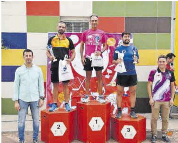
Els tres primers classificats locals masculins de la mitja maratón.

A banda, es va desenvolupar la VI Marxa de Muntanya no competitiva, on molts esportistes de la localitat van poder demostrar la seua resistència.