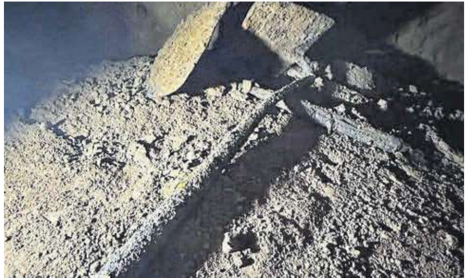
Objectes trobats a l'interior del refugi, envellits pel pas del temps.