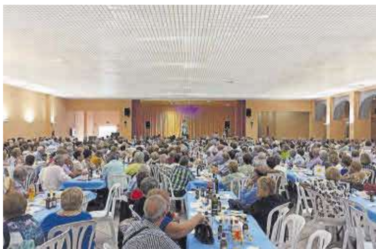
El Saló Multifuncional també comptarà amb instal·lacions solars fotovoltaïques.

S'estan redactant també els projectes que permetran les licitacions públiques per a poder executar aquest nou projecte en matèria d'energia renovable. Així, l'empresa encarregada de realitzar aquestes anàlisis i tràmits és Su-Planeta-Solar, companyia especialitzada en la