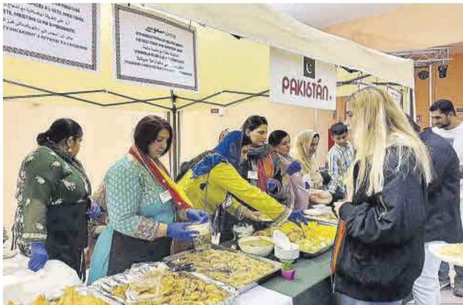
Una jove s'interessa pels plats preparats per la comunitat de Pakistan a la trobada de Nules.

Cal destacar, a més, el caràcter solidari d'aquest esdeveniment, donat que la recaptació de la venda dels tiquets va destinada a la Creu Roja.