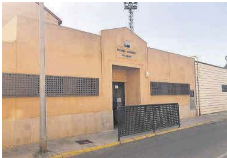
La piscina municipal és un dels locals on s'instal·laran plaques solars.

Amb tot, l'Ajuntament de Nules ja ha sol·licitat les ajudes destinades a aquestes instal·lacions emmarcades en el Pla de Recuperació, Transformació i Resiliència que gestiona la Generalitat Valenciana.