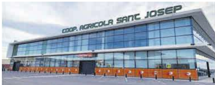
El Charter principal de la Cooperativa Agrícola està a la senda Mitjana.