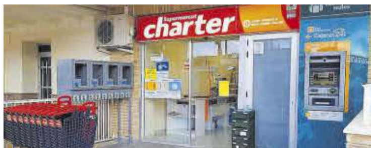
El Charter de les platges de Nules, a l'avinguda de Mallorca, 83.