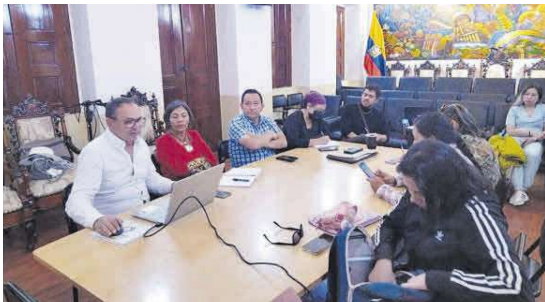
Imatge de la visita de Romero a Otavalo, en una reunió amb gent d'eixa localitat equatoriana.

El projecte, el centre d'atenció psicològica Kausay Sapi (que significa arrel de vida ), ha sigut una experiència de col·laboració