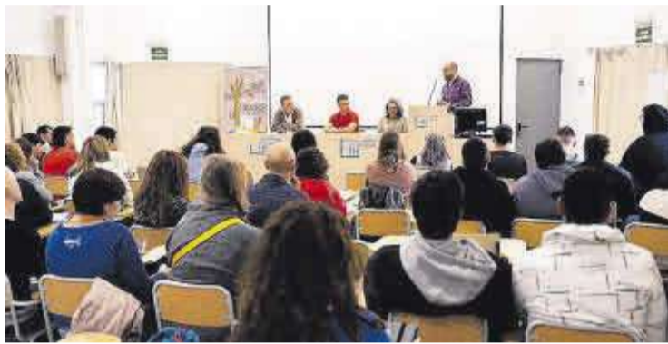
Una ponència de la jornada sostenible que va tindre lloc a l'institut.

També es va presentar el manifest d'Horts Escolars com a ferramenta Ecosocial Transformadora; al mateix temps que es van donar a conèixer exemples de productors i