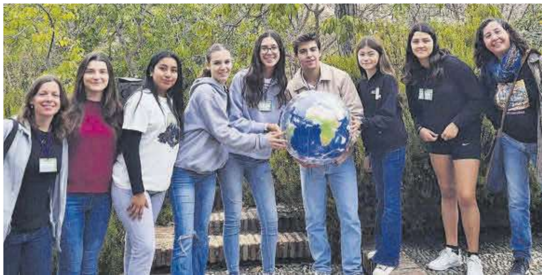
Els membres del CEIP Lope de Vega amb altres participants en la VI Conferència Estatal de Joves a Sierra Nevada.

Un grup d'estudiants de l'escola participa en la VI Conferència Estatal de Joves de Granada