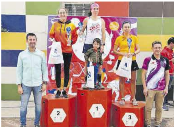
Les corredores que van conformar el pòdium local de la categoria femenina.