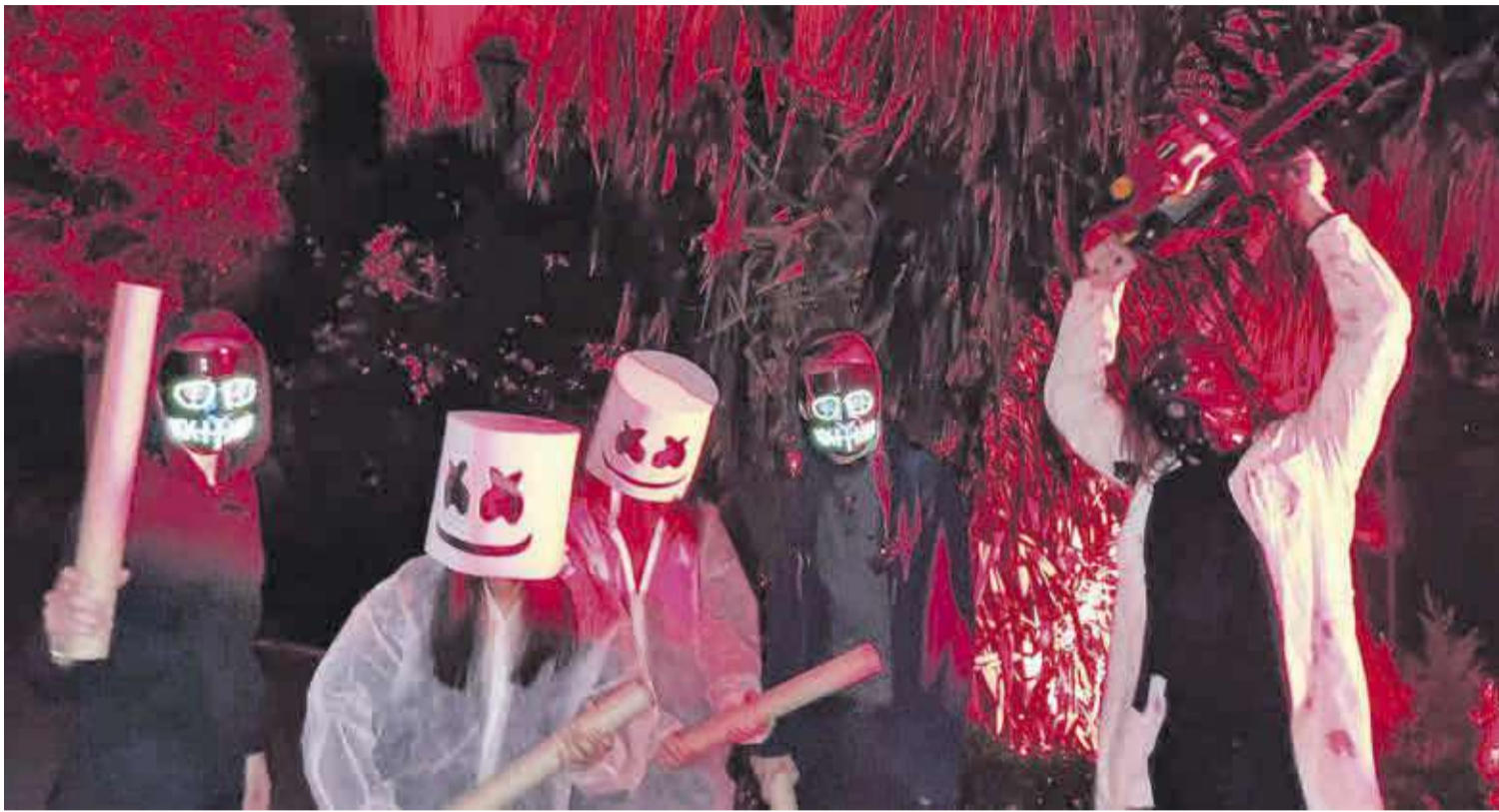
Joves nulers participen a l'activitat del Passatge del Terror organitzat per la Regidoria de Joventut el passat 31 d'octubre.