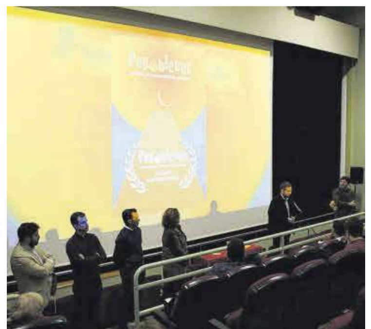
Un moment del lliurament de premis de l'anterior edició del certamen.