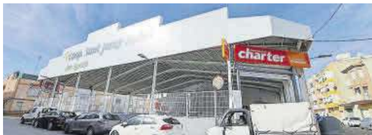
El nou Charter de la Cooperativa es troba al carrer de Sant Agustí, 23.

Així doncs, enguany, la Cooperativa Agrícola Sant Josep de Nules té previst repartir al voltant de 100.000 euros en les seues bonificacions.