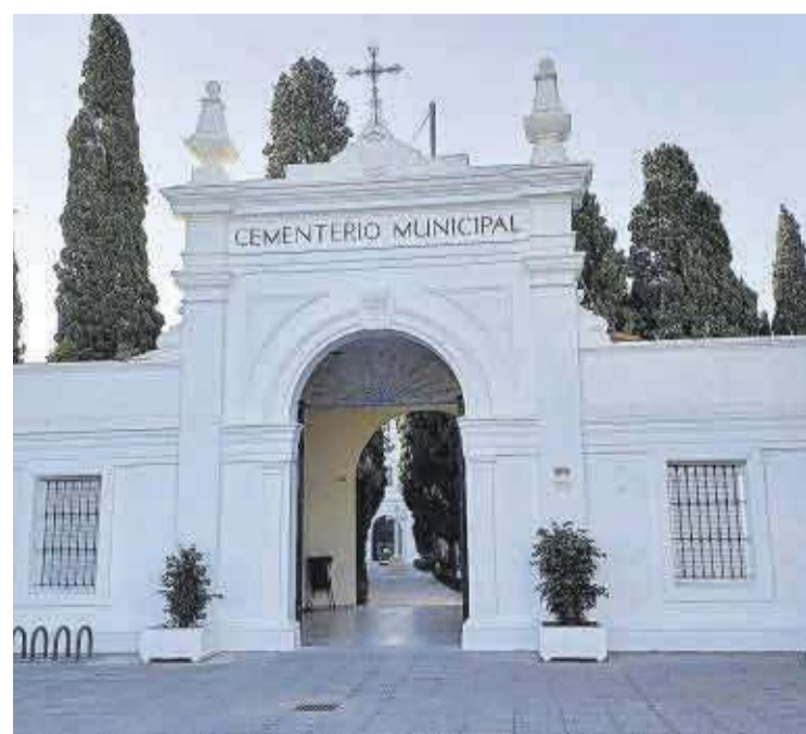
La porta principal del cementeri de Nules, pintat per a Tots Sants.

Durant la festivitat, es va establir un horari especial d'obertura tant del cementeri municipal com del de Mascarell, que va ser des de dissabte 28 d'octubre fins a dimecres 1 de novembre de 9.30 a 19.00 hores sense interrupció.