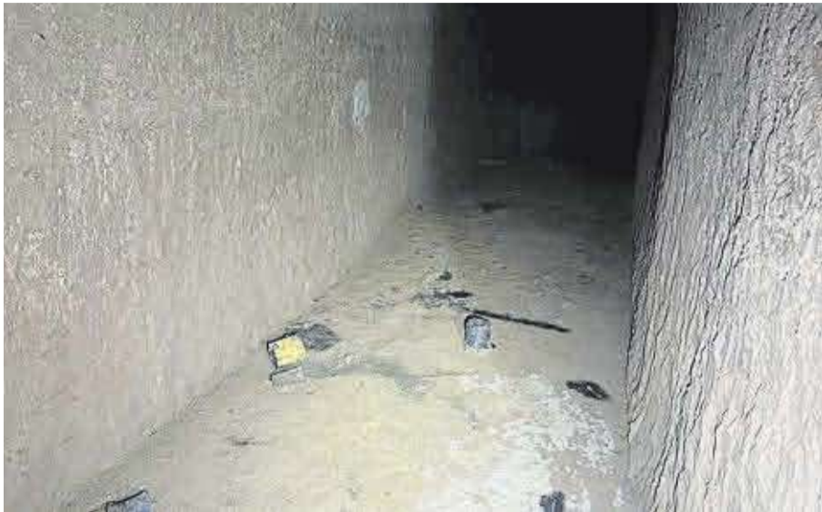
L'interior de l'estància, el dia del seu descobriment.