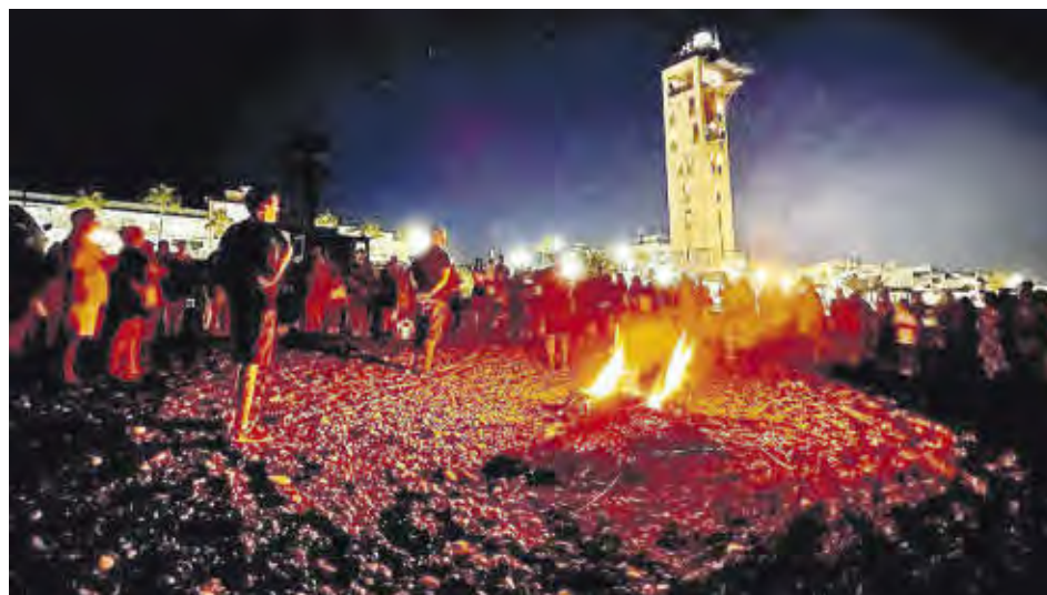
La ruta pels voltants del Far va concloure recordant les antigues senyals de comunicació a la costa.

L'associació Platges de Nules aporta tota una sèrie d'activitats a la programació de les festes de Sant Roc a la platja, en les quals manté la seua reivindicació en defensa dels valors patrimonials del poblat marítim.