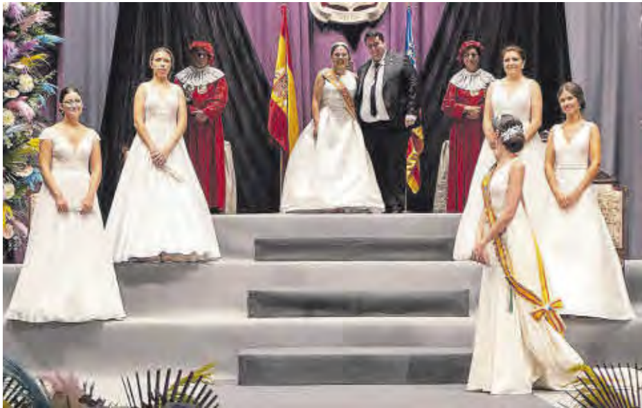
El Teatre Alcázar va acollir un any més l'acte de presentació de la representant de les festes de Nules.