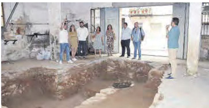
Una representació del consistori va visitar les obres per a conèixer les troballes.