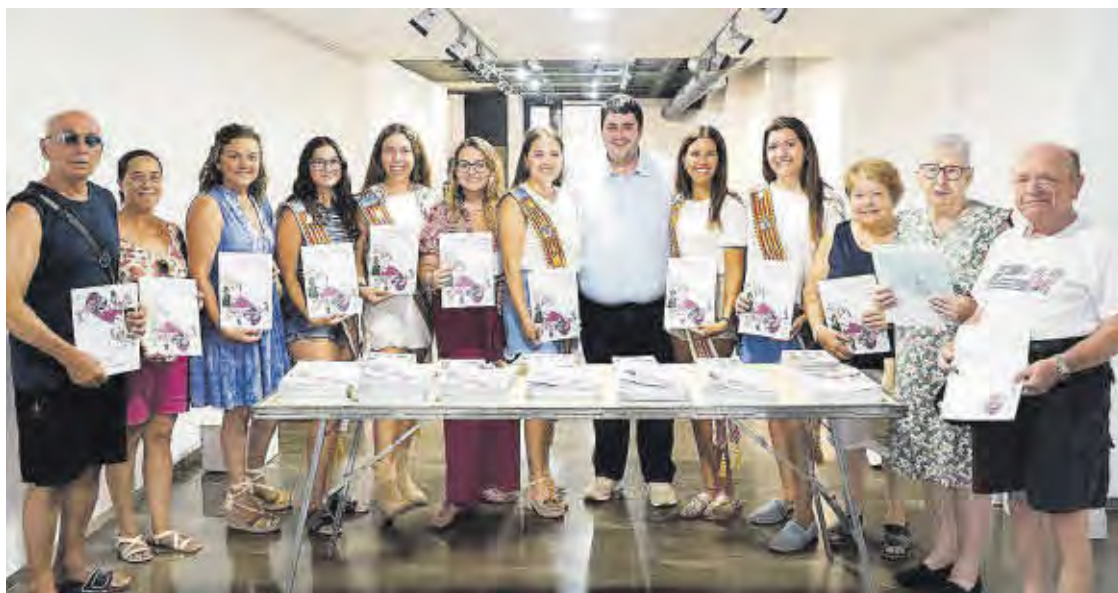
La Reina de la Vila i la seua cort d'honor, juntament amb l'alcalde i la regidora de Festes van repartir el programa.

Els més menuts podran gaudir també de tallers, jocs i d'un parc aquàtic infantil a la Terrassa de l'Estany. De la mateixa manera que el 12 d'agost es commemorarà el Dia Mundial de la Joventut amb