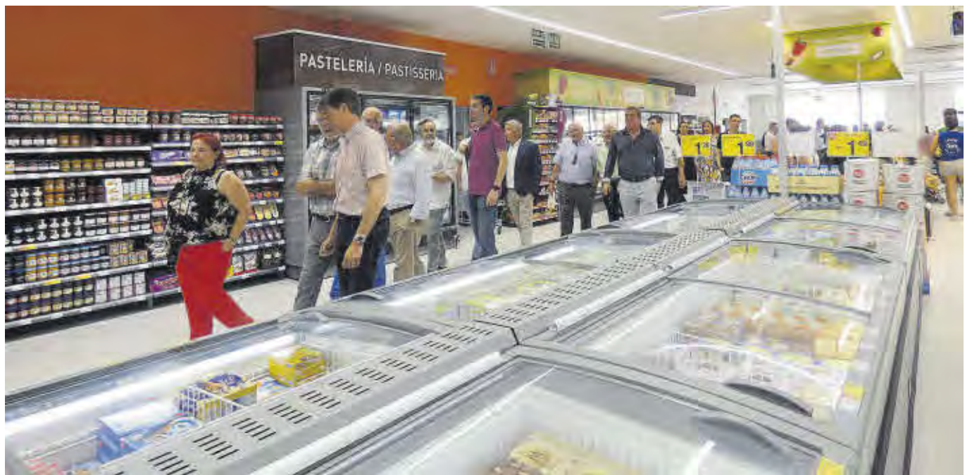
Les noves instal·lacions disposen de 900 metres quadrats de tenda, a més d'un pàrquing de mil metres quadrats.

Arenós va destacar com d'aquesta nau, construïda als anys 70, s'ha aprofitat l'estructura i s'ha adaptat l'ús a les necessitats actuals amb 900m 2 de tenda, un pàrquing de mil m 2 amb punt de càrrega per vehicles elèctrics i una coberta renovada.