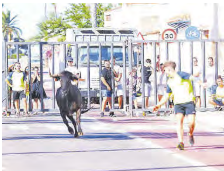
El primer cap de setmana de les festes a la mar va tindre actes taurins.