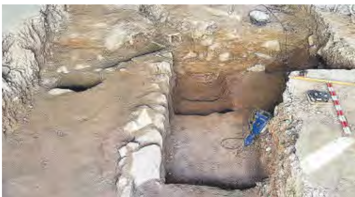
Els treballs ja estan permetent recuperar part de l'antiga muralla.