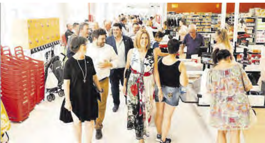
El Consell Rector i les autoritats van visitar el Charter mentre els primers nulers feien la compra.