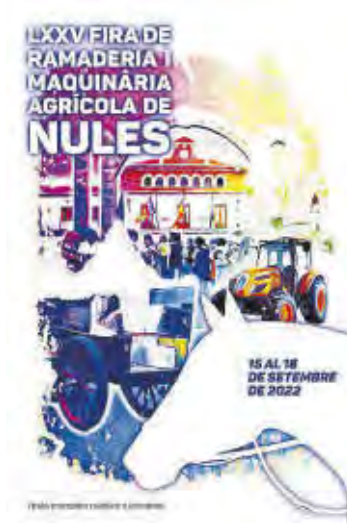
Cartel de la última edición de la Fira.