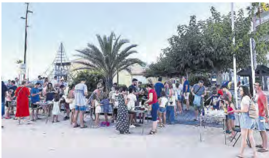
La jornada del Dia Mundial dels Fars va començar amb un taller de retallables per a totes les edats.