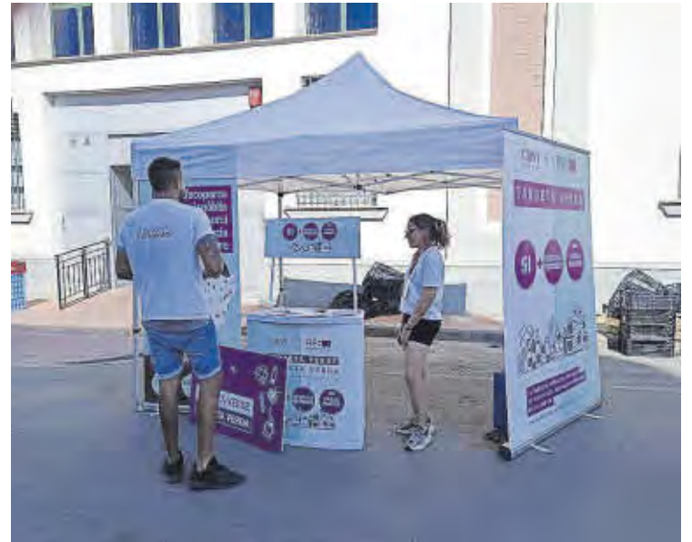
La campanya d'informació es va realitzar al mercat municipal.