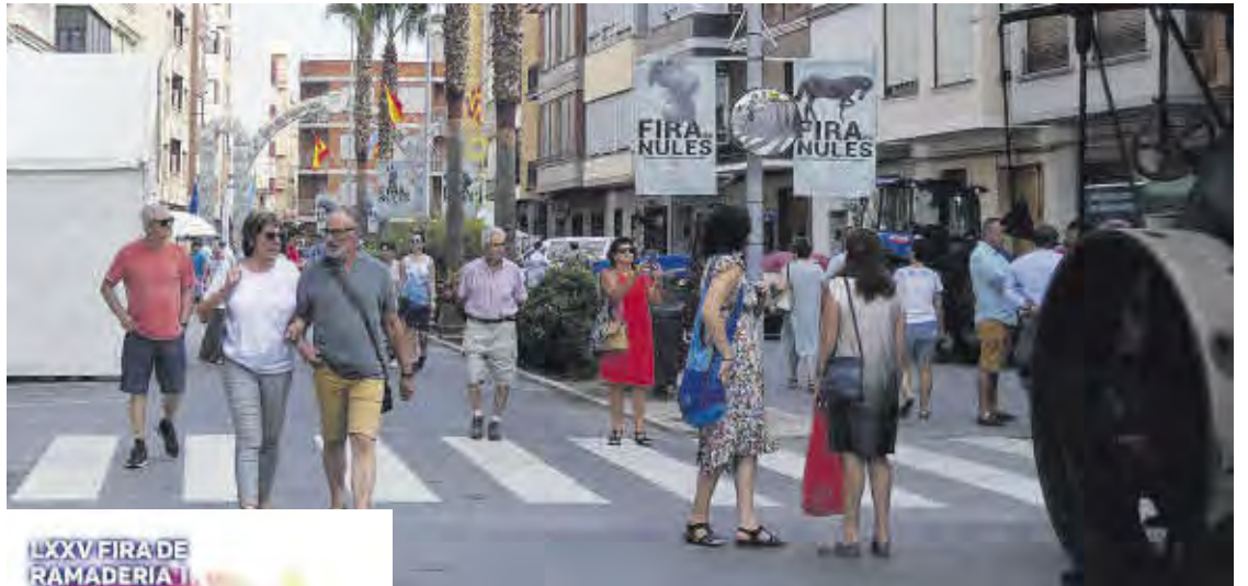
La tradicional Fira de Ramaderia i Maquinària Agrícola de Nules acostumbra a recibir una gran afluencia de público edición tras edición.

Los trabajos deberán contener en su diseño gráfico aspectos relacionados con la temática de la feria: agricultura, ganade-