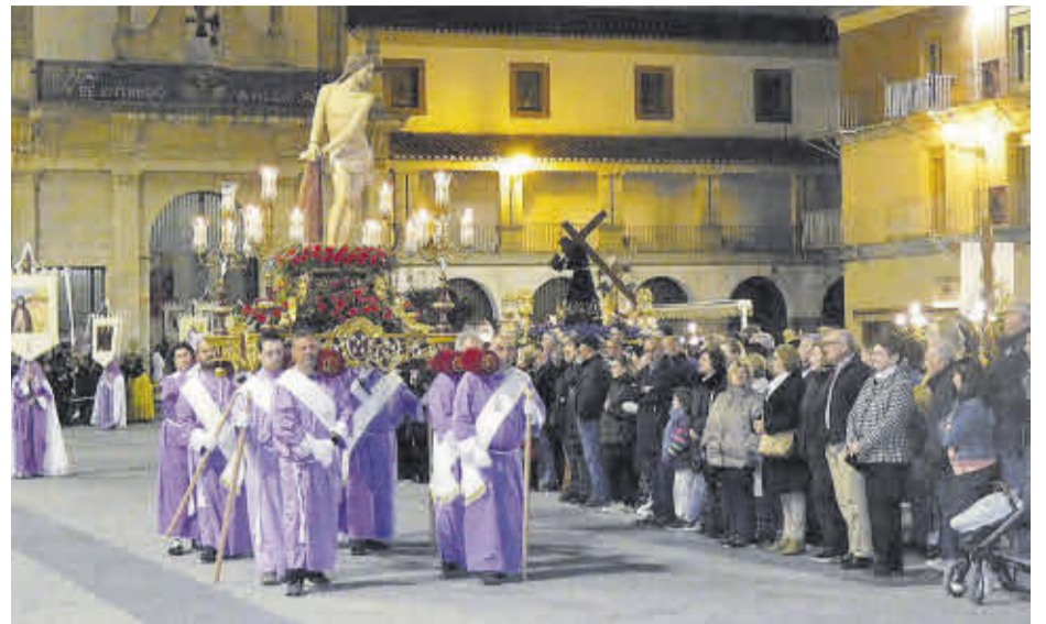
Enguany s'ha celebrat el 25è aniversari de la imatge del Crist de la Sang.