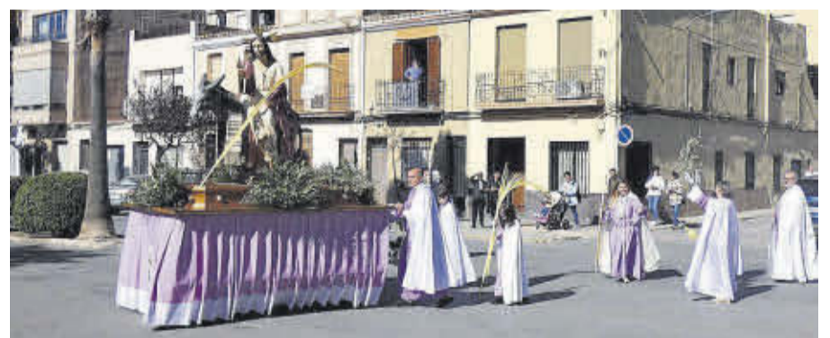
La imatge de la Burreta va anar en processió fins l'ermita de Sant Xotxim per a presidir la missa.