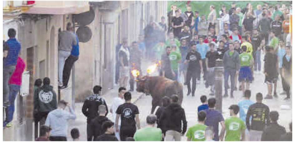
La penya L'Esmorzar del Bou va patrocinar un bou cerril que es va embolar per la vesprada.

Les festes del barri d'El Salvador han sigut de nou les encarregades d'estrenar el calendari anual d'actes taurins a Nules.