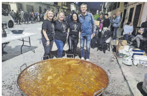
El sopar de germanor és un dels plats forts de les festes.