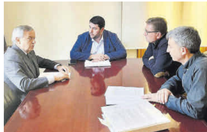
L'alcalde es va reunir amb representants de Novalam durant el passat març.

L'empresa Novalam Innovación ha iniciat els tràmits per a instal·lar-se al polígon Vía Augusta després d'haver adquirit una de les parcel·les disponibles en la nova zona en expansió en la carretera N-340.