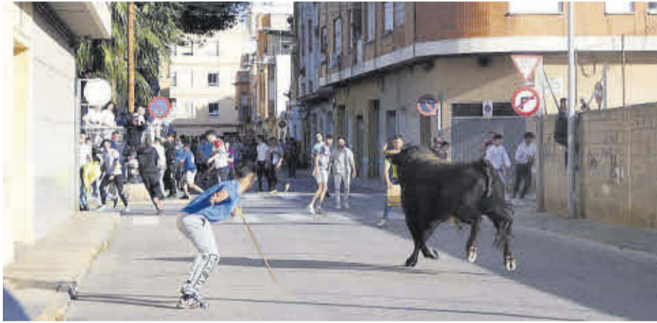
Nombrosos aficionats van seguir les exhibicions taurines del barri d'El Salvador.

La cagà del manso va ser la gran novetat d'enguany i el sopar de germanor l'esdeveniment més multitudinari, amb 900 persones