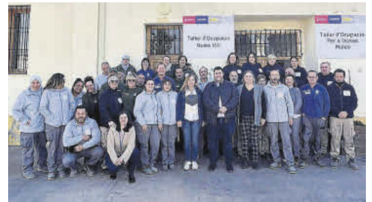
L'alcalde i la regidora d'Ocupació amb els alumnes del nou taller d'ocupació.

Des de l'Ajuntament es destaca l'esforç dels departaments d'Intervenció i de Tresoreria, i la gestió econòmica realitzada en aquesta legislatura que no sols s'ha reflectit en el romanent positiu «sense deixar de fer coses», també en la reducció del període mitjà de pagament a proveïdors que s'ha reduït considerablement.