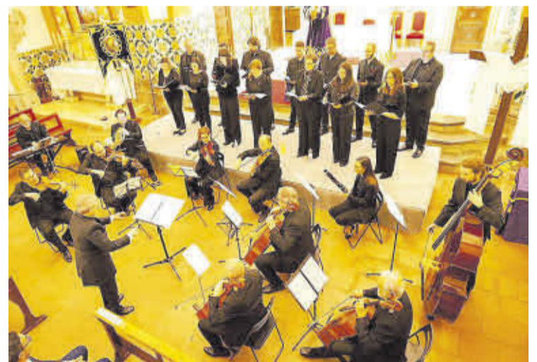
Música Viva va cantar el 'Rèquiem' de G. Fauré durant el Pregó al Convent.