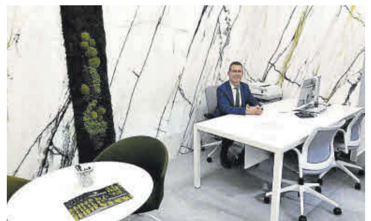
Nombroses persones van acudir a la inauguració de la seu de Ruralnostra a Nules, on va tindre lloc el lliurament del xec de l'Obra Social de Ruralnostra a l'associació local Un organ per a tots.