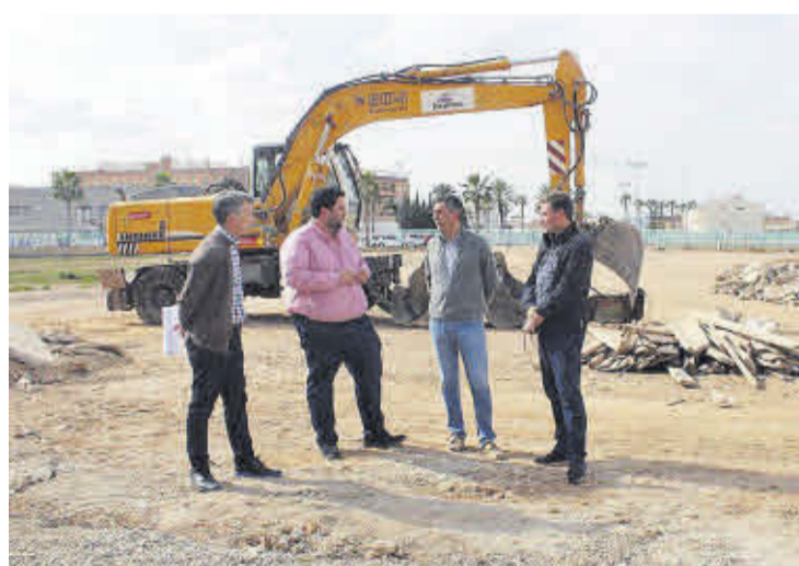
L'alcalde va visitar les obres a mitjans del passat mes de març.

Amb aquesta actuació Nules obtindrà una superfície de 5.097,10 metres quadrats per a ús residencial i es podran construir 20.388,40 metres quadrats de sostre la qual cosa es tradueix en una construcció aproximada de 170 habitatges, de manera que del total dels 10.395,74 metres quadrats de superfície en els que s'actua en aquest projecte també es con-