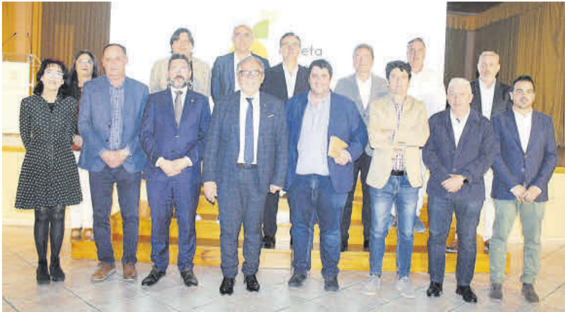
La presentació de Nuleta va reunir nombroses autoritats al Saló Multifuncional de Nules el passat 31 de març.