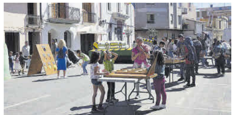
Els més joves van gaudir amb diversos jocs, unflables i pintacares.