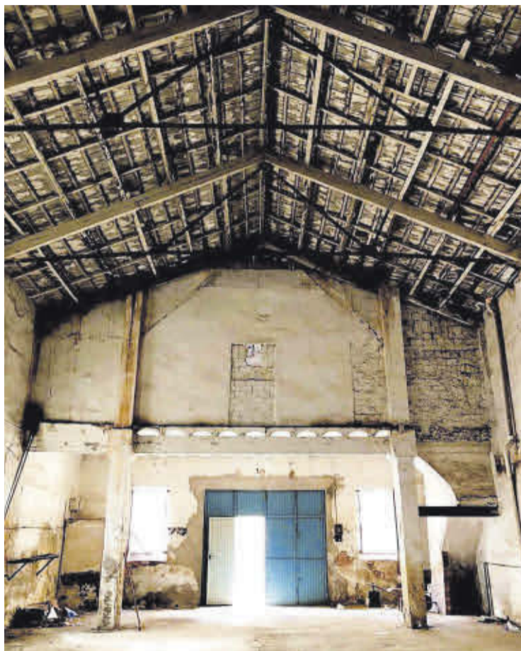
Interior de l'edifici del carrer de Sant Jaume on s'ubicarà el nou Museu d'Història.