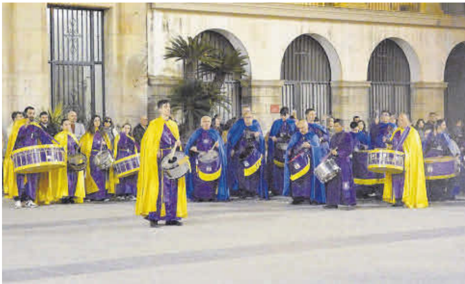
L'Exaltació del Bombo i Tambor va recuperar el seu format original en l'edició número 21.