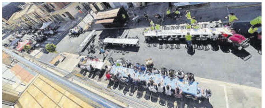
El concurs de paelles va omplir de taules el carrer de Santa Natalia.