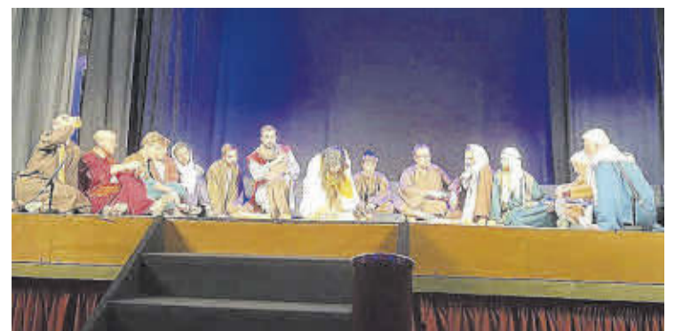
Els joves de les parròquies de Nules i Borriana van representar 'La Passió'.