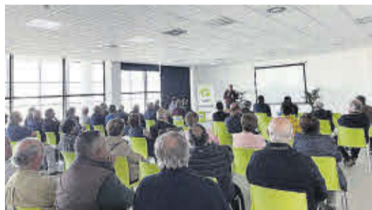
Les instal·lacions de la Cooperativa van acollir les diverses activitats que es van desenvolupar durant la VI Fira Agrícola