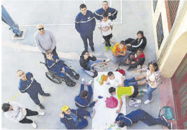
Els joves i els integrants d'ESTEM van participar en la nova iniciativa.

Els joves participants i els membres de l'associació ESTEM