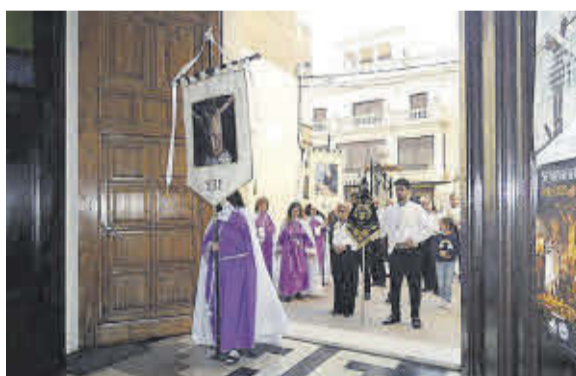
El Via Crucis a la Immaculada amb l'Agrupació Musical Jaume I.