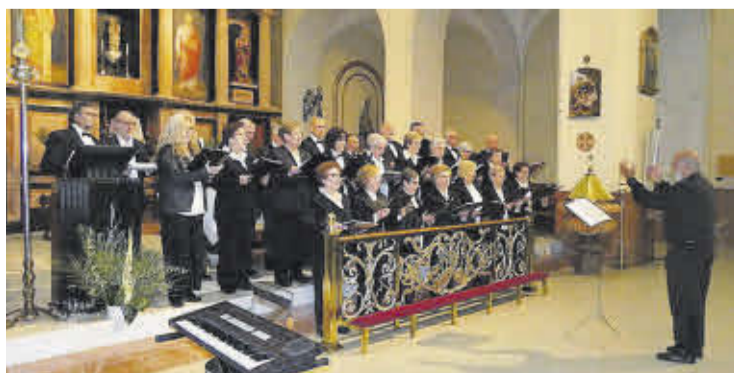
La Coral Sant Bartomeu va oferir un concert a l'Arciprestal el dissabte de Rams.