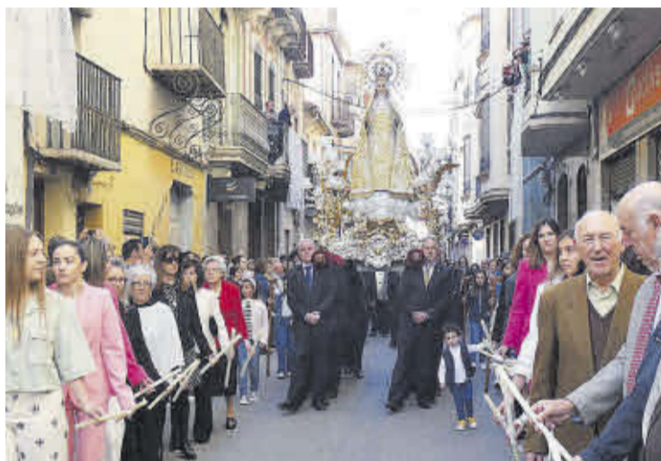
La Soledat, amb el mant blanc, avança cap a l'Encontre amb Crist ressuscitat.

Com és tradicional, els moments més emotius es van viure amb la processó de Divendres Sant i l'Encontre del Diumenge de Resurrecció.