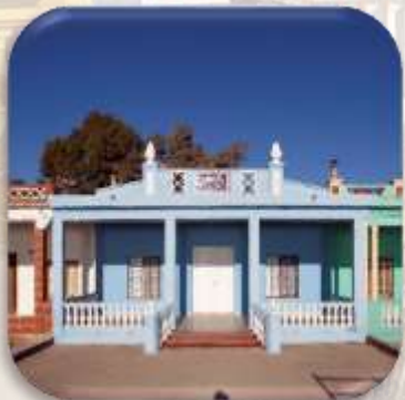
Font: Carme Ripollés

Vols conèixer l'evolució de les nostres platges?